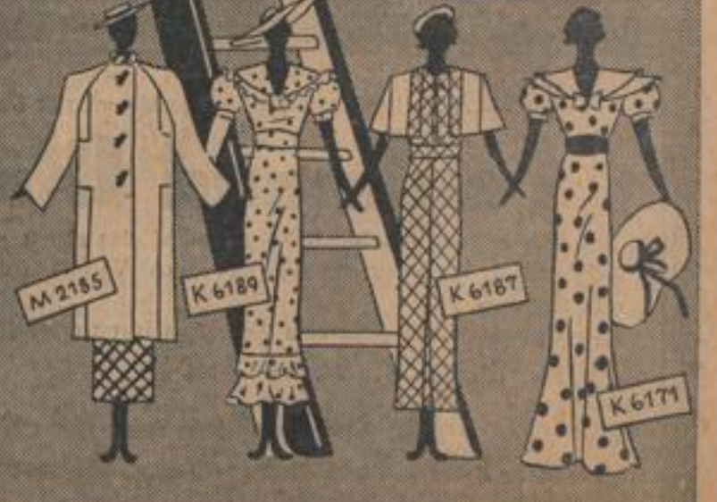
Viele hundert neue Modelle zwanglos zu besichtigen an den bekannten Verkaufsstellen fast aller Städte

So einfach fügt sich Teil an Teil beim „sprechenden“ Ullstein-Schnitt. Er gibt nicht nur das Kleid Teil für Teil in Seidenpapier zugeschnitten — er trägt auf allen Schnittteilen auf- gedruckte Anleitungen, die sagen, was überall zu beachten ist. Mit großen, deutlichen Buchstaben sagt er, was ein Schnittteil darstellt, wie er an einen andern gehört, wo man Falten legen, wo säumen, wo ein- reihen muß usw. Dieser Aufdruck, „Sprache“ genannt, erleichtert das Selberschneiden unendlich und schließt Fehler aus. Alle klugen Frauen, die für neue Kleider nicht mehr ausgeben wollen als das Geld für Stoff und Zutaten, die schneiden selber nach „Sprechendem“ ULLSTEIN Schnitt!