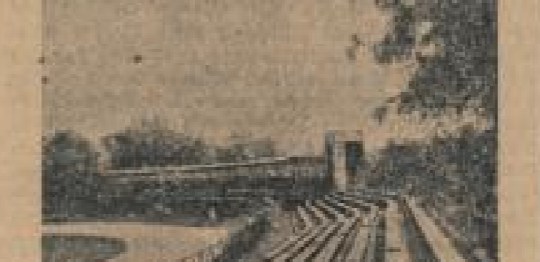
Laufpferde an der Rennbahn. (Zum Hintergrunde der Pferdemannschaft.)