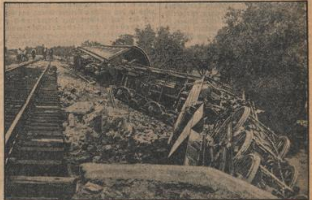
Der zwischen Haifa und Lod verkehrende Nahdug erlitt infolge eines Attentats, das Araber verübt hatten, der Lokomotivführer und Beisitzer wurden getötet.