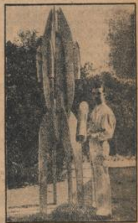
Eine neue Stratosphären-Kofete

sondern die neuen Regenschellen, die man für die Olympischen Spiele in Berlin erheben kann, um auch auf den nichtüberdachten Plätzen geschützt zu sein. Die Hülsen, die aus einem besonderen Papier bestehen, werden durch die Reichsportverwaltung vertrieben.