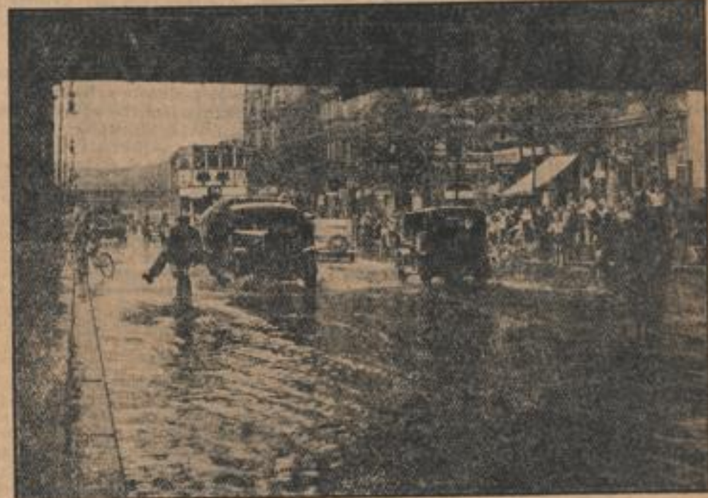
Sinnlos in Berlin

Die Reichshauptstadt wurde von einem wolkenbrucharigen Regen heimgesucht, der in verschiedenen Stadtteilen zu Ueberflutungen führte, so daß der Verkehr teilweise lahmgelegt wurde.