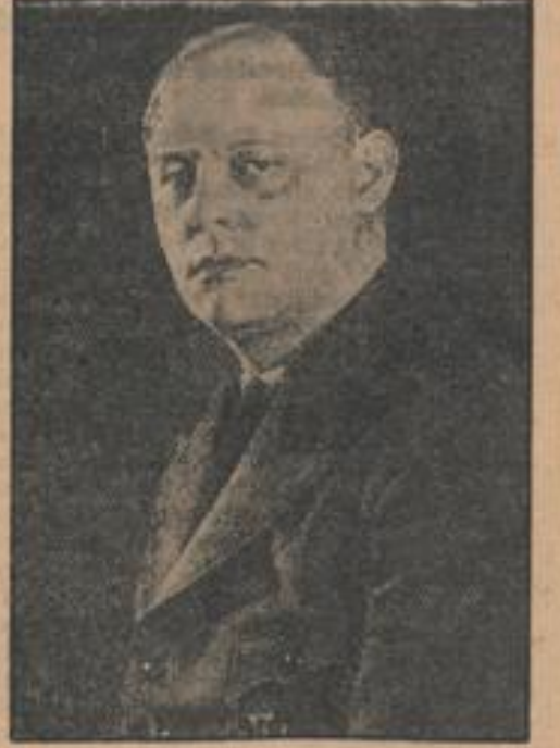
Hauptamtsleiter Pa. Hilgenfeldt, abt. A. Hofmann.

Die NSB teilt mit: Im Rahmen der großen Werbestellung der NSB im Grenzgebiet Baden wird am kommenden Samstag und Sonntag der Hauptamtsleiter im Amt für Volkswohlfahrt der NSB, Pa. Hilgenfeldt, Berlin, in zwei Großrundgebungen sprechen.