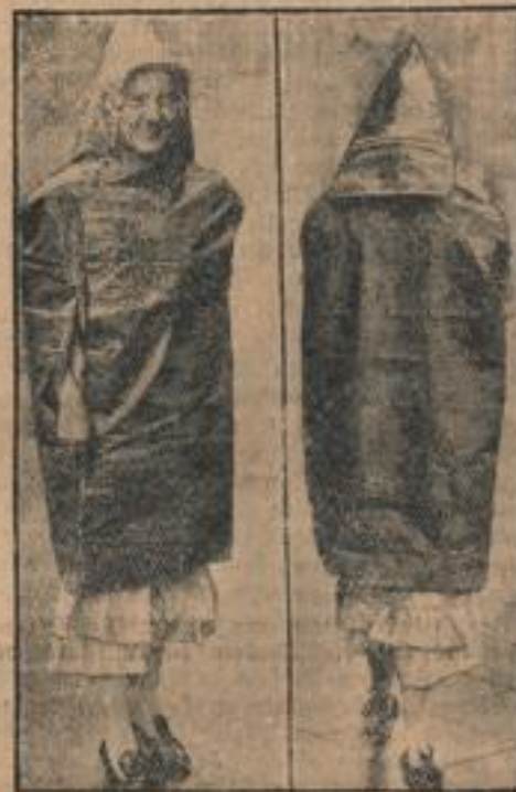
Rein neuer Au-Ring-Ran,

Die Reichshauptstadt wurde von einem wolkenbrucharigen Regen heimgesucht, der in verschiedenen Stadtteilen zu Ueberflutungen führte, so daß der Verkehr teilweise lahmgelegt wurde.