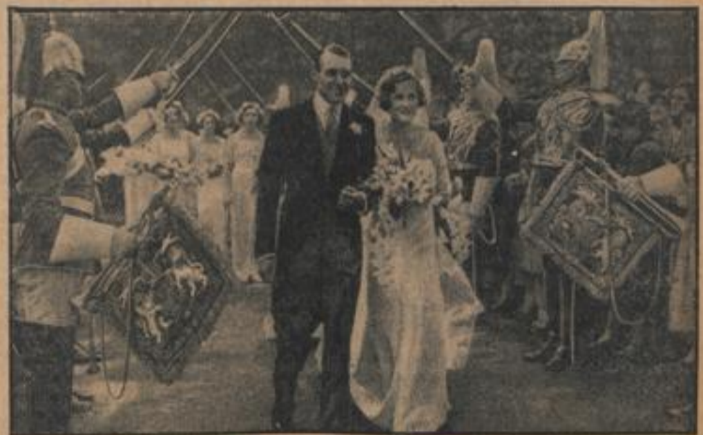
Hochzeit mit eigener Leibgarde