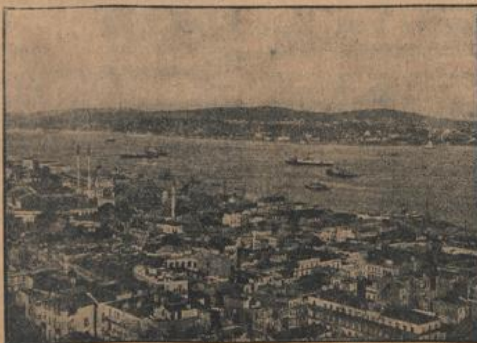
Blick auf Istanbul, das Tor am Bosphorus

Der Weltkrieg hat dann die Bedeutung der Dardanellen erweitert. Im Frieden eine seiner wenigen Verkehrsstraßen mit der übrigen Welt, wurden sie für die Russen zur einzigen sicheren Stapsenstraße; denn die Geschütze der deutschen Flotte sperrten die Ostschäfen, und die Häfen am Weißen