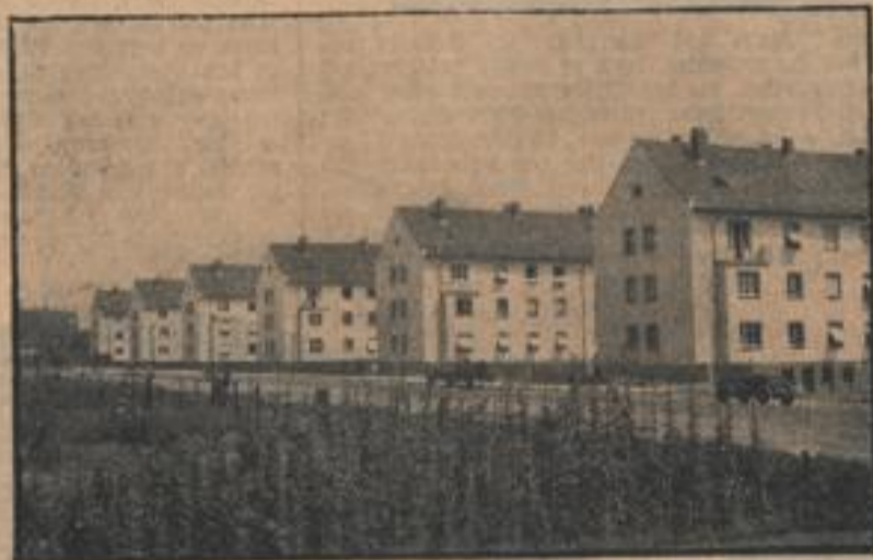
Über 100 neue Wohnungen in der Untermühlaustraße

die monatliche Miete für das Gartenstück, das jeder Wohnung vorbehalten ist, eine Mark beträgt, dann darf man hoffen, daß im nächsten Jahre auch hier Gemüse und Blumen kräftig gedeihen werden. Die Gemeinnützige Baugesellschaft, die schon so viel zur Beseitigung der Wohnungsnot beigetragen hat, darf für sich das Verdienst in Anspruch nehmen, daß sie mit der Errichtung dieser 108 Wohnungen für Angestellte und Arbeiter keine geschaffenen hat, die in jeder Beziehung als musterhaft bezeichnet werden dürfen.