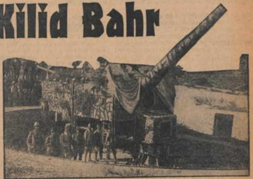
Ein während des Weltkrieges eingebautes Geschütz: es stammt vom Panzerkreuzer „Roos“

und Abodos lagen, wo die Ufer Europas und Asiens sich zusammendrängen und dem stark strömenden Wasser nur eine Breite von 1300 Meter lassen, erbauten die Türken zwei weitere feste Schloßer. Kilid Bahr nannten sie das eine, was deutsch heißt „Meeresriegel“, und Kale i Sultaniye — Sultansschloß — das andere. Und zwischen den festen Schloßern enthielten Batterien und Werke bis nach Gallipoli auf dem europäischen und Tschanak Kalefi auf dem asiatischen Festlande.