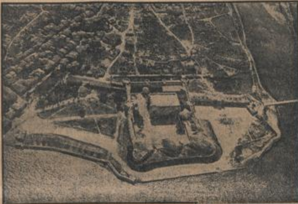
So sah das Fort Tschimenling vor der Schließung aus

Meer-Bekken haben, entweder in den Besitz der Meerengen zu gelangen oder aber den Besizer in der Verfügungsgewalt durch freiwillig abgeschlossene oder erzwungene Verträge zu beschränken. Die imperialistischen Tendenzen der westeuropäischen Staaten fanden ebenfalls ein Hindernis an den Dardanellen, und je stärker sie um ihren Einfluß in Ost- und Europa zu ringen hatten, um so nachdrücklicher kämpften sie für die freie Durchfahrt durch die Dardanellen oder die Sperrung der Wasserstraße.