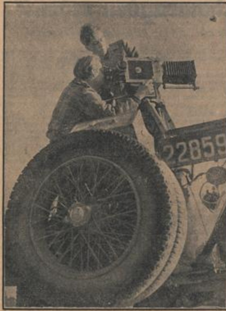
Fahraufnahme von galoppierenden Reitern aus dem Heck eines starken Wagens An der Kamera: Albert Benitz und Klaus von Rautenfeld.

wende, weil von hier aus der Altonaer Fried- logungsreicher Weg in die Bezirke der Weltgeschichte