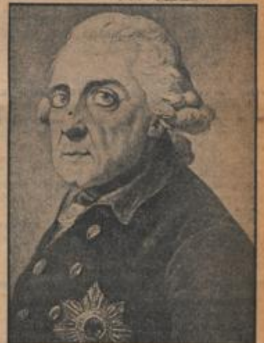
Oben: Das Kind Friedrich, Nachbild aus dem Oelgemälde von A. Fedne, 1713. — Mitte: Der junge König nach dem Oelgemälde von A. Fedne, 1769. — Unten: Der König nach einem Oelgemälde von Anton Graf.