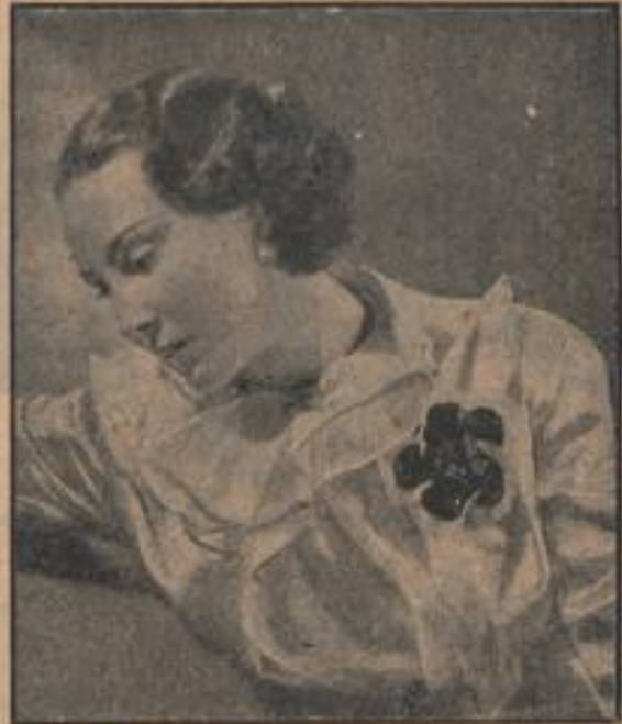
Lida Baarova, die Trägerin der weiblichen Hauptrolle