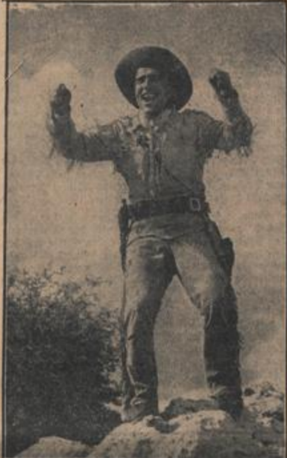
Da liegt das Märchenland! Der Auswanderer Johann August Suter entdeckte von den Höhen des Felsengebirges das Paradies Kalifornien.

Mit Kanaken, die er auf den Sandwich-Inseln anwerben ließ, wollte er die Urbarmachung dieses märchenhaft fruchtbaren Landes durchführen.