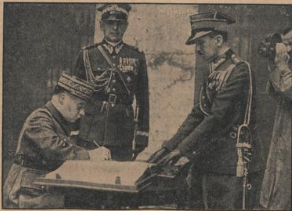
Der französische Generalstabschef Gamelin legte am Ehrenmal des unbekanntem Soldaten in Warschau, wo er sich zur Zeit zu Besuch aufhält, einen Kranz nieder...