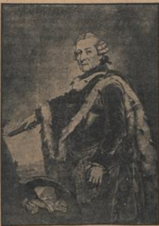
Der Alte Fritz, wie ihn Zlessens gemalt hat

(Fortsetzung auf Seite 4 der Sonntags-Beilage)