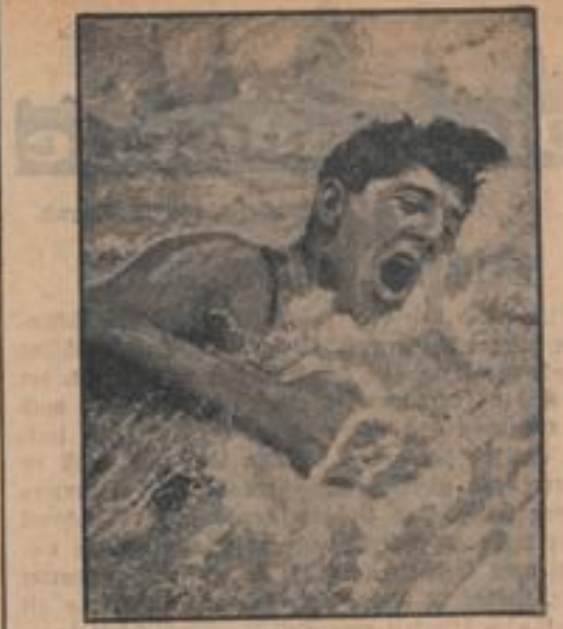
Medica an der Wende Der Amerikaner Medica an der Wende im swallen Vorlauf beim 1500-Meter-Freiwasserschwimmen, den er hiermit beendet. (Atlantik, W.)

Neuheiten! Noch jagten niedere Volksecken über und hinweg, noch dreht sich fern ein Dampftrug. Mit dem ersten Blick aber, der nun herabfährt, ist alles anders geworden. Kuckuckstörchen. Tot... Brüllen, jamohl brüllen! Zwischen zwei Booten liegend haben wir uns mittschiffs zusammengesetzt und plaudern nun ein wenig über die Anfänge der Firma Bad. Pflandern, habe ich gefragt? Man sollte seine Worte auf die Goldwaage legen! Brüllen, jamohl brüllen, das ist das einzig Richtige!