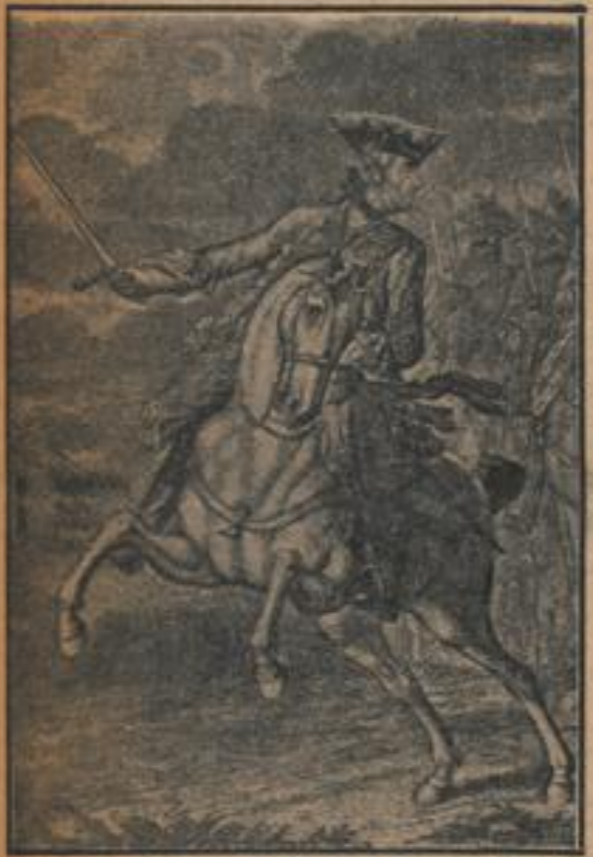
Der Preußenkönig nach einer Radierung von D. Chodowicki, 1758

Das traurige Ende der Unternehmung ist faßsam bekannt. Um Morgengrauen verläßt der Kronprinz sein Lager, legt statt der preussischen Uniform französische Kleider an und will aus dem Hause, um auf dem gerade in Steinfurt stattfindenden Hochmarkt