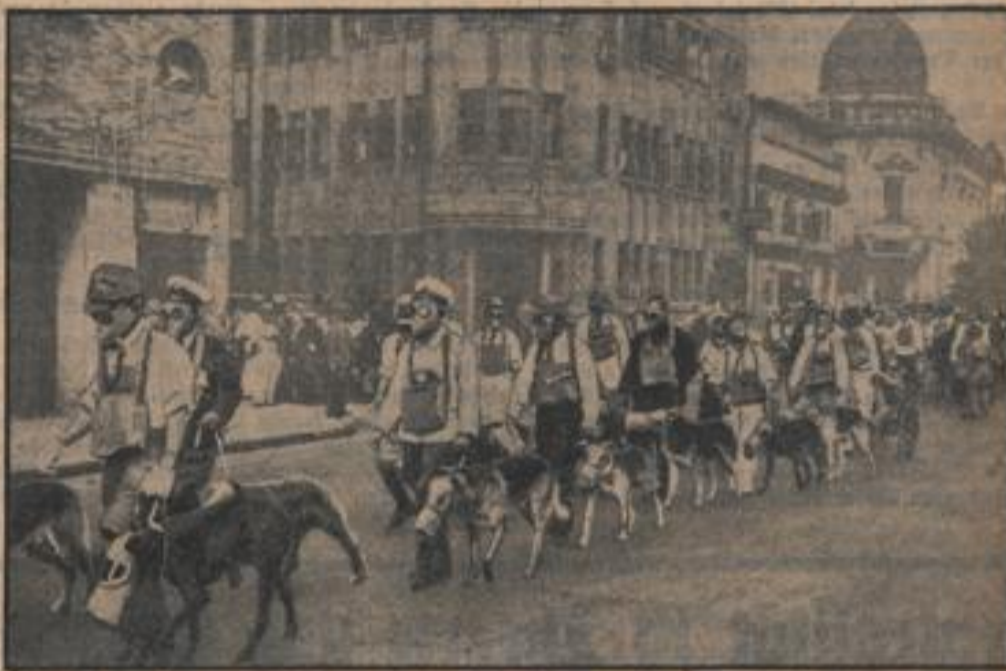
Eine Parade der Weibehunde des spanischen Meeres, die mit Gasmasken ausgerüstet sind.