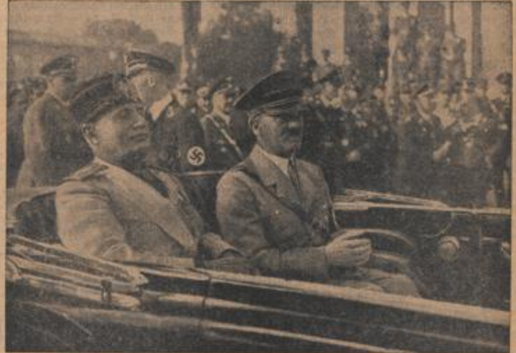
Der Führer und sein Gast bei der Fahrt durch die Hauptstadt der Bewegung