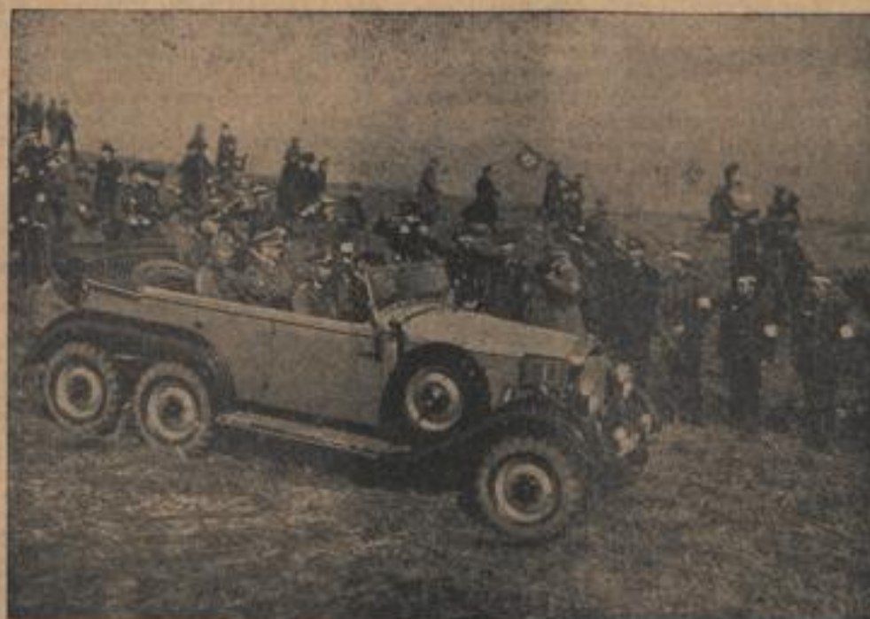
Der Führer mit dem Duce im Mecklenburger Wandvergelände (Eberl, Sonder-Nr.)