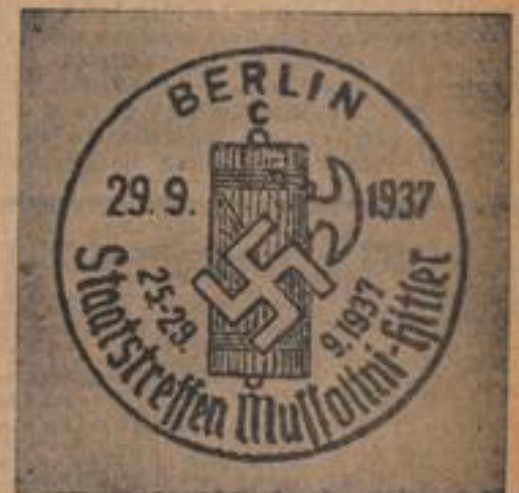
Der Sonderstempel der Deutschen Reichspost zum Staatsbesuch