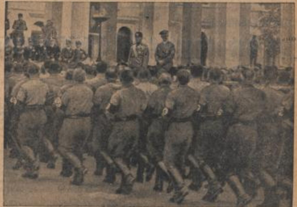
Der Vorbeimarsch der Parteiformationen: Die Blutordenträger vor dem Führer und dem Duce