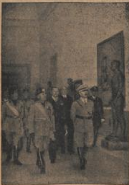
Im Haus der Deutschen Rüst: Der Duce mit dem Führer bei dem Besichtigungsgang durch die Meisterwerke der deutschen Rüst. Führer Außenminister Giano