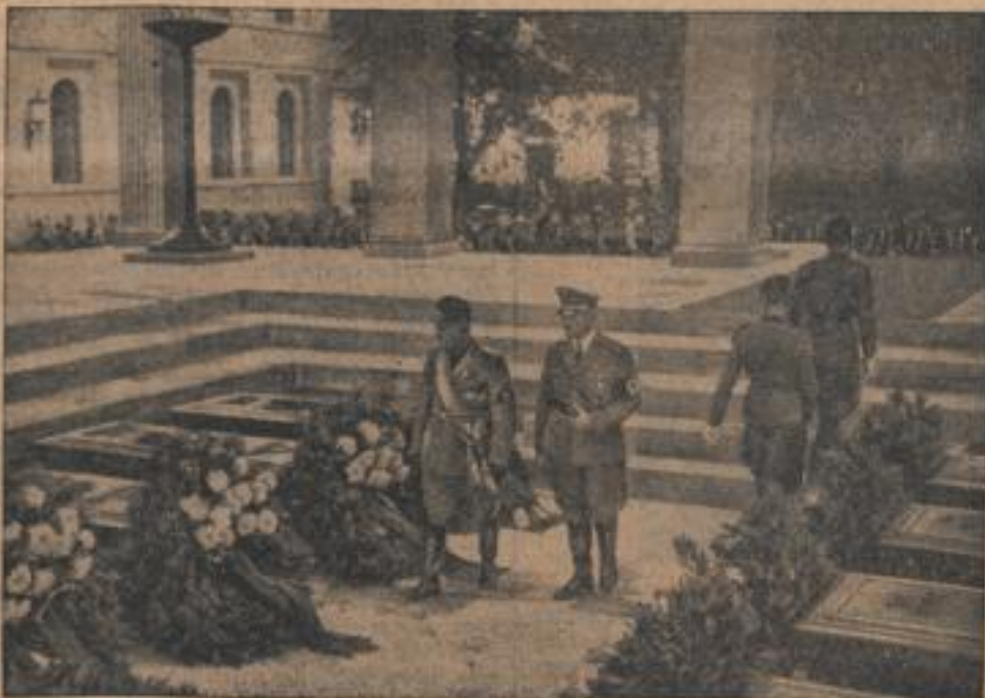
Der Duce ehrt die Gefallenen der Bewegung; Mussolini und der Führer im Ehrentempel der Ewigen Ruhe in München nach der Kranzniederlegung des Duce