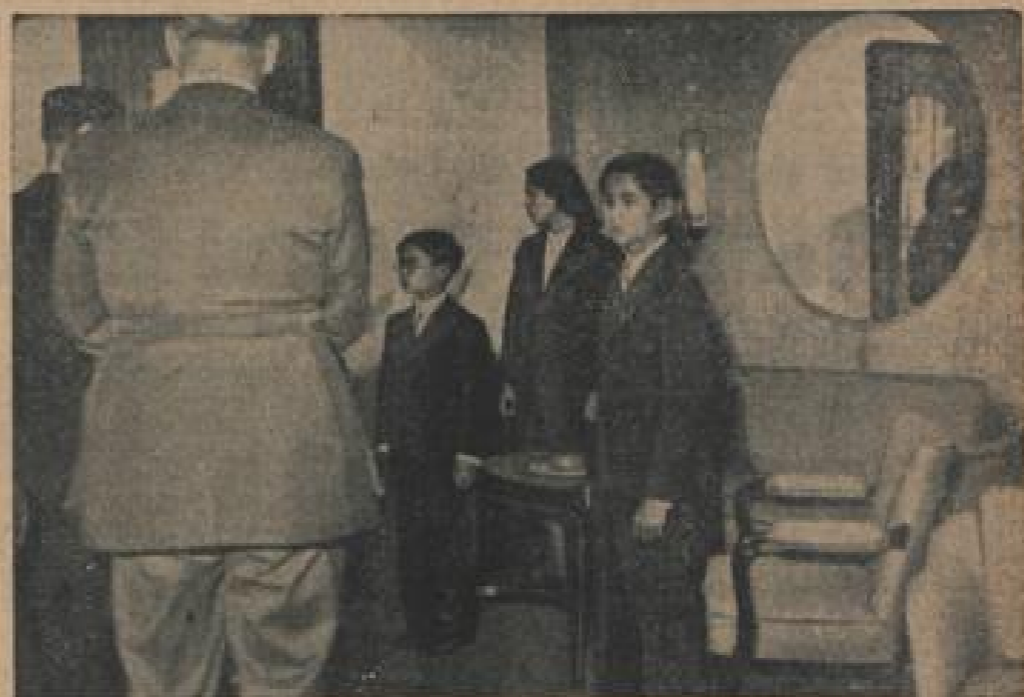
Siams König kehrt zum Schulbesuch nach Europa zurück Unter Bild zeigt den jugendlichen König Kwanda von Siam bei seiner Ankunft in Marseille. Von rechts nach links: König Kwanda, seine Mutter und sein jüngerer Bruder.