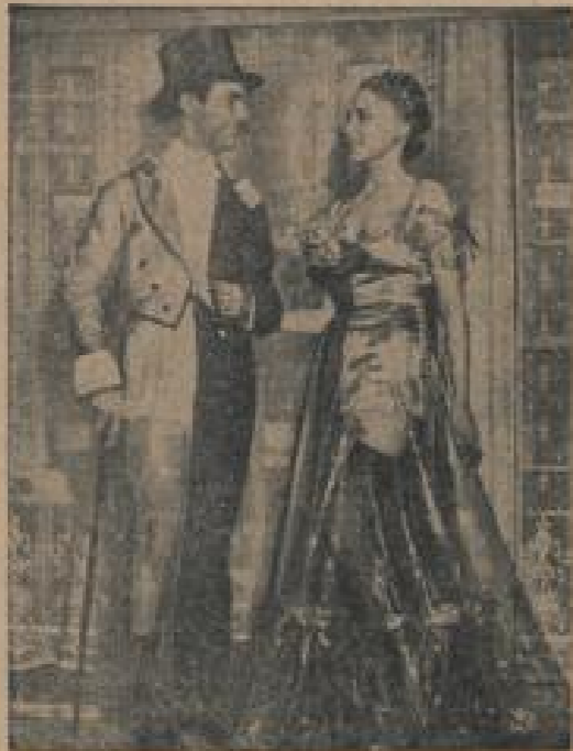
Ist das der „letzte Modeschrei“? Oder wird nur auf einer Modenschau ein letztes angesagtes Paar gezeigt. Parade vom Schmal bis zur Unterwäsche. Damit sich alle überreden konnten, erließen diese Damen bald in Saiten geschalt und bald im Wendelstiel.