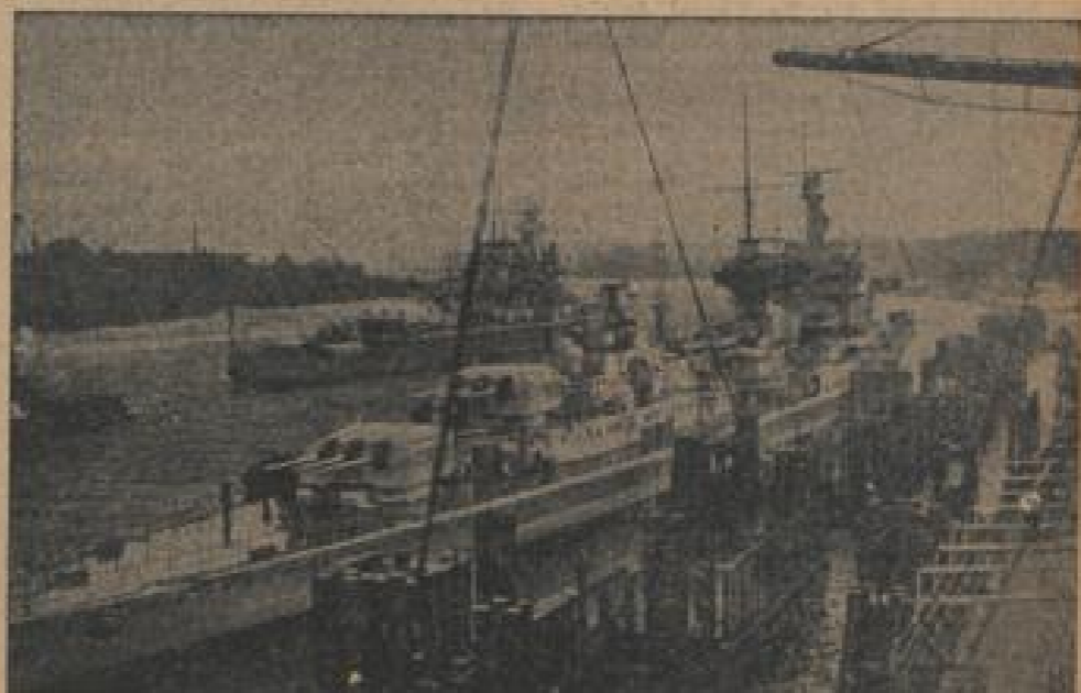
Das Einlaufen des Staatsbesuches des Führers zu den Feierlichkeiten des Stapellaufes des Schlachtschiffes „Bismarck“ treten im Hamburger Hafen des letzten Kreuzer „Karnuberg“ und das Panzerschiff „Admiral Geyer“ ein.