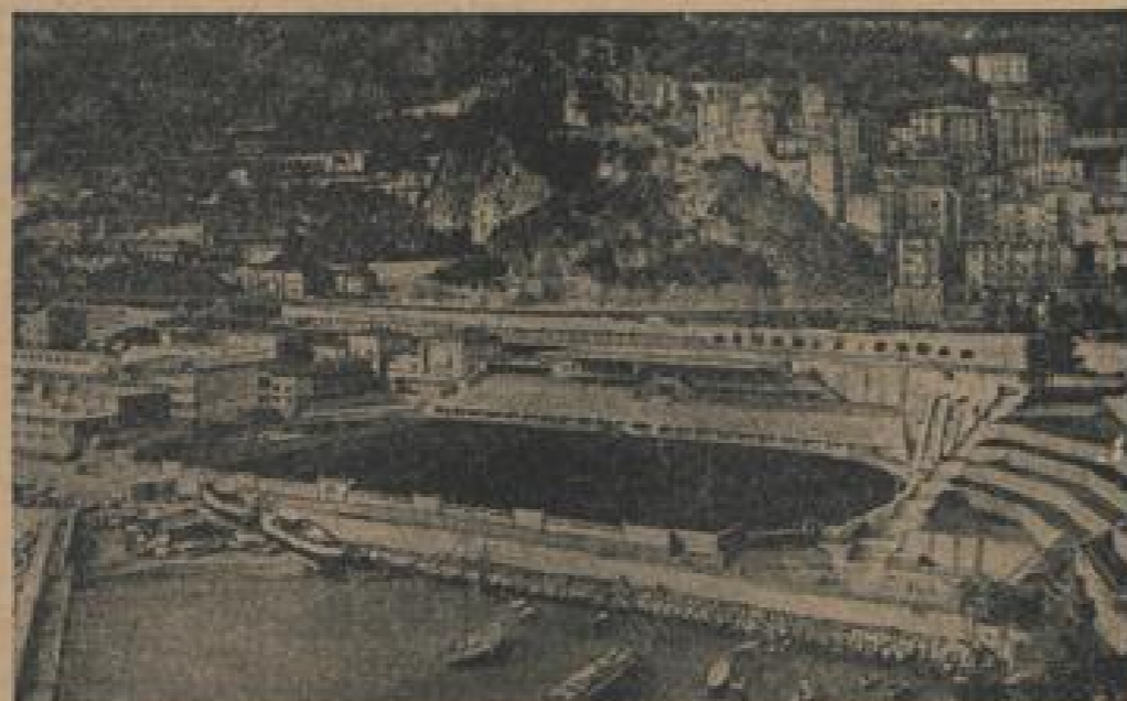
Das schönste Stadion der Welt Es hat herrlich gelegene Stadion von Monte-Carlo. Das liegt am Mittelmeer gelegen. 25.000 Zuschauer saß und im April d. J. eingeweiht werden soll. (Schluter, Sonder-R.)