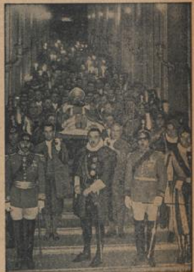
Die Ueberführung des toten Papstes nach St. Peter In feierlicher Form wurde die heilige Pille des verstorbenen Papstes Pius XI. auf der Diplomatischen Parade in die Peterskirche in Rom übergeführt.