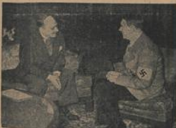
Außenminister Gino-Parlowitsch verabschiedete sich