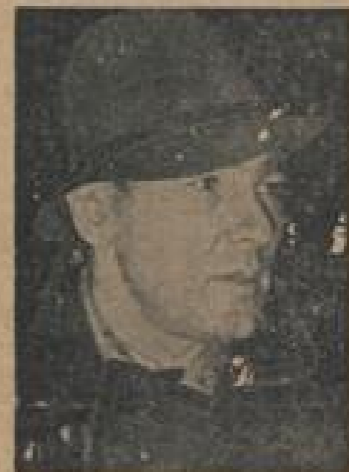
Oberleutnant Pulkowski verunglückte in Madras Auf seinem Rückweg von Kuba ist der deutsche Flieger Oberleutnant Pulkowski in Madras (Tamilnadu) während eines Kontrollfluges verunglückt.