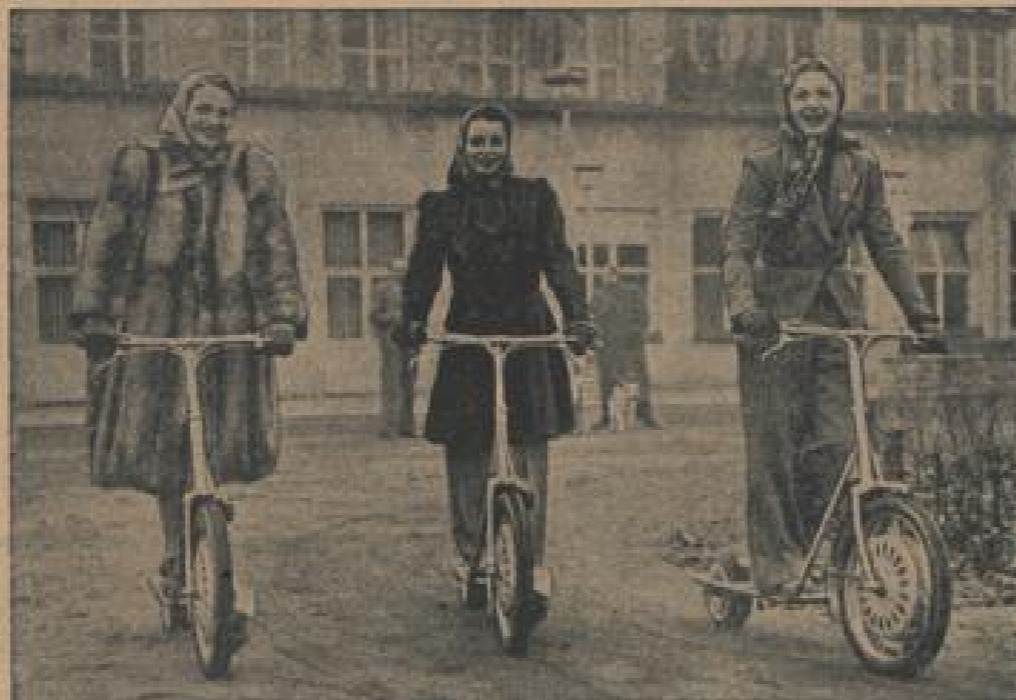
Der Motorroller ist da! Überhaupt noch nicht offiziell. Er wird aber in dem Baller „Ein Kuh reiß um die Welt“, das anlässlich der Internationalen Automobil-Ausstellung in Berlin aufgeführt wird, zu sehen sein. (Schluter, Sonder-R.)