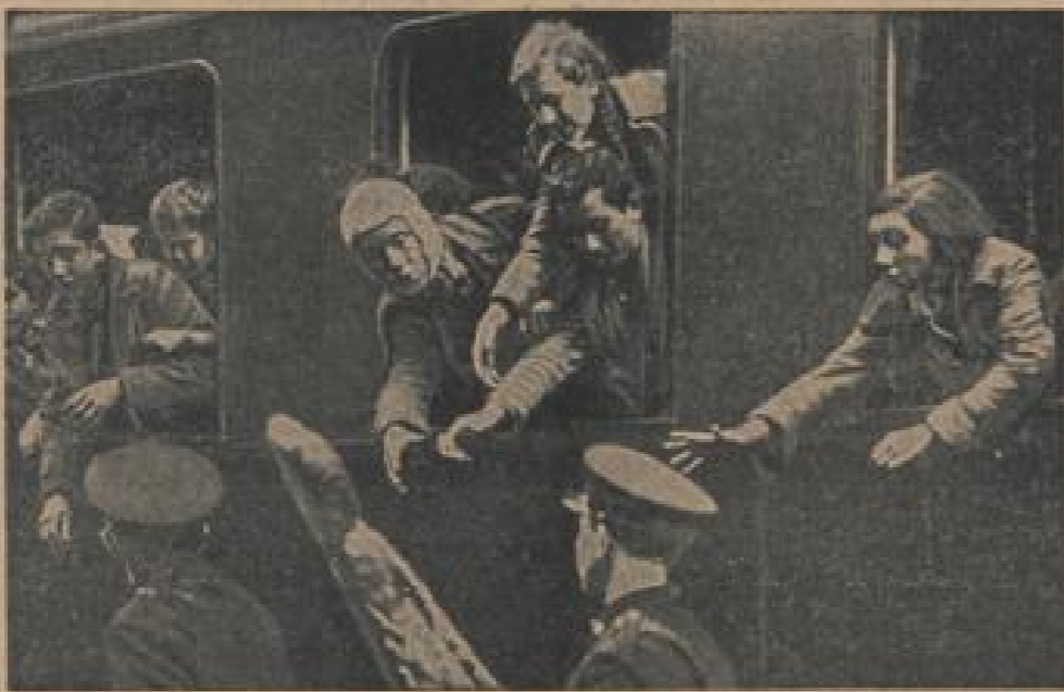
Opfer spanischer Sahpropaganda Flüchtlinge aus dem noch von den Nationalisten besetzten Teil Spaniens drängen sich bei der Ankunft in Gern nach den Broten, die von Gendarmen verteilt werden. (Weltbild, Sonder-Kulturstieg-R.)