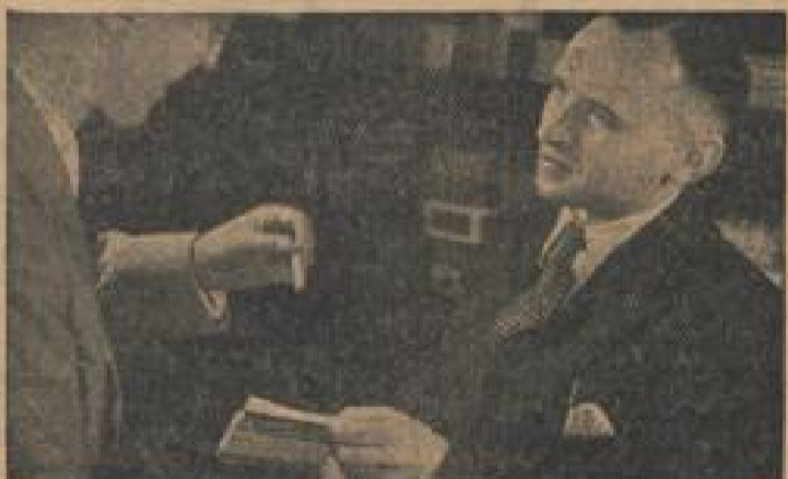
„Die „Astra“ geht weg wie frische Brezeln“