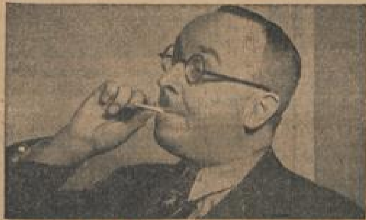
Durch Erfahrung zur „Astra“.