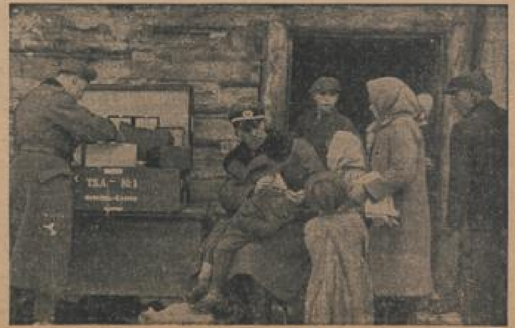
Unsere Truppen in Mäkten Ein deutscher Truppenarzt unterlegt Schilflinier. (Klönig, Jander-Multiplex-B.)