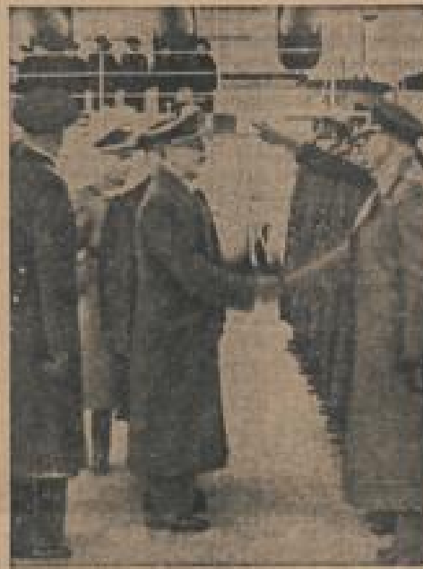
Die Abfahrt des Führers von Zwinemünde Der Führer begrüßt die Offiziere des Panzerkorps "Deutschland".