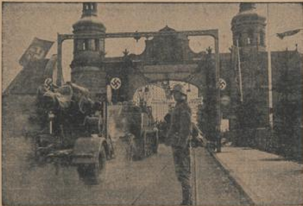
Die Artillerie auf dem Marsch über die Tilsiter Königin-Luise-Brücke (Preffe-Gollmann, B.)

Die Stunde der Befreiung schlug im Memelland!