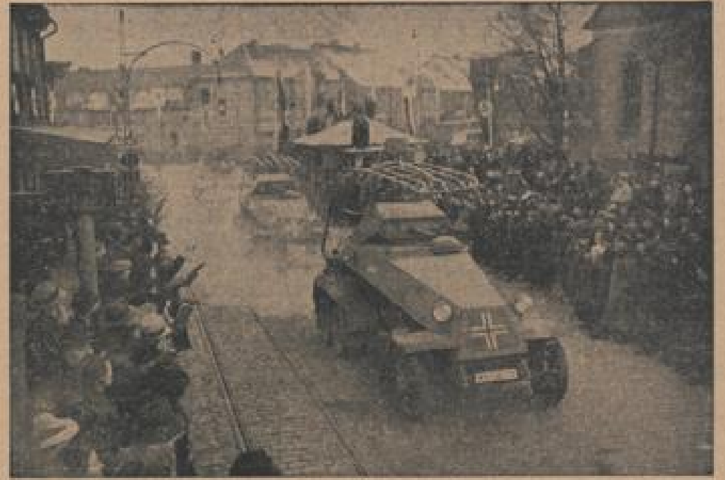
Deutsche Truppen ziehen ins befreite Land Panzerkampfwagen übersetzen beim ehemaligen Zollhaus in Tilsit die alte Grenze