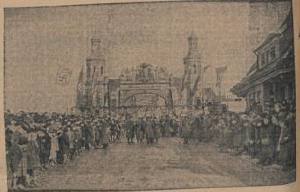
Die Grenze nach Memel fiel! In Hunderten warteten sie an der erdähnlichen Königin-Luise-Brücke in Tilsit, als die Grenze fiel und der Weg ins Memelland frei wurde.