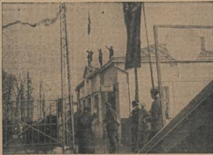
Die deutsche Flagge auf dem litauischen Zollhaus Nach der Bekanntgabe der Rückkehr des Memellandes nach Deutschland wurde auf dem litauischen Zollhaus am Vollensteintor auf der memelländischen Seite die Holentzugsbahn gerüstet.