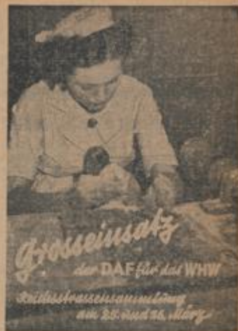
Zeit Monaten sind viele hundert Hände damit beschäftigt, aus dem von den Brandversicherern geleisteten Material die kleinen weißen Hühner, welche am 20. und 21. März zum Verkauf kommen, herzustellen.

Es darf auch kein Handwerker mit dem Gedanken spielen, daß die nach § 11 des Gesetzes vorgesehene Altershilfe ihm ja immer noch offen stehen werde.