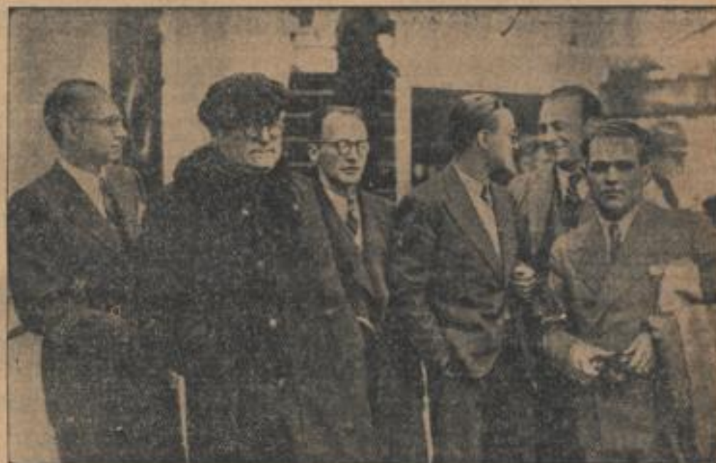
Der frühere spanische General Miaja (mit Hut) bei seiner Ankunft in Marseille. Miaja war bekanntlich der Oberbefehlshaber in Madrid, das er jetzt nach dem Sieg der Franco-Truppen verließ.