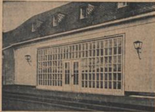
Der Eingang zur Jugendherberge in Fulda (Weißbild, Zander-Multiplex-R.)

Der Reichsjugendführer weihte gleichzeitig mit der „Wilhelm-Friedrich-Jugendherberge“ in Fulda 16 Jugendherbergen in allen deutschen Gaue.