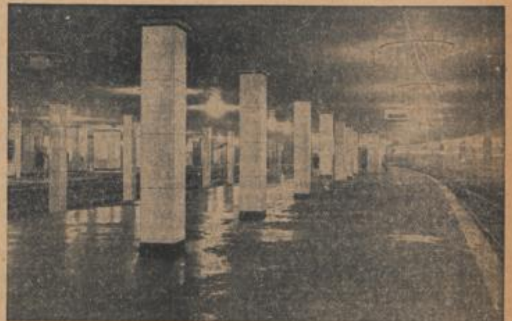
Der größte U-Bahn-Hof der Welt wurde in Berlin eröffnet. Nach mehrjähriger Bauzeit ist nunmehr der unterirdische U-Bahn-Hof Potsdamer Platz seiner Bestimmung übergeben worden.