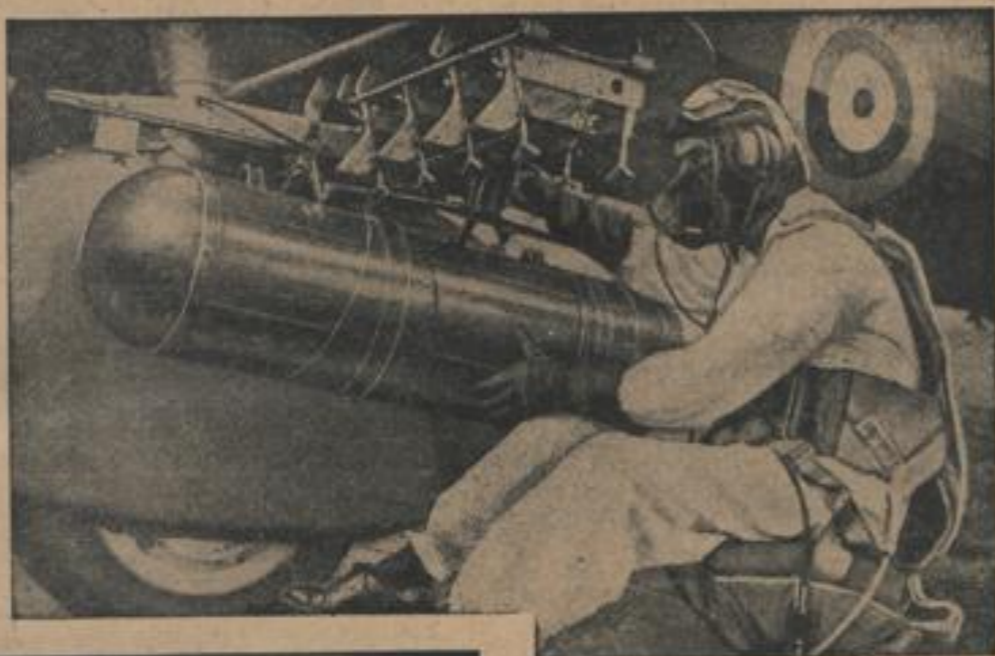
Nahrungsmittelbomben werden montiert Anlässlich einer Vorführung der englischen Luftwaffe auf dem Flugplatz in Handinge wurden Lebensmittelbomben abgemontiert. — Unter Bild zeigt einen englischen Piloten beim Anbringen einer Lebensmittelbombe.