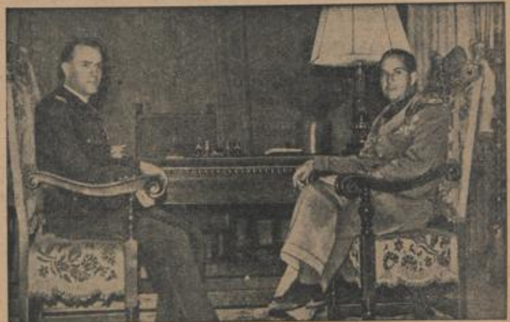
Rumäniens Außenminister in Rom Der rumänische Außenminister traf in Rom ein, wo er im Palazzo Chigi eine Konferenz mit dem italienischen Außenminister hatte.