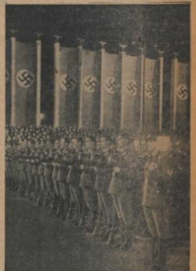
Helm ab zum Gebet! Im Lustgarten zu Berlin (Eberl-Wilderdienst, Zander-Multiplex-R.)