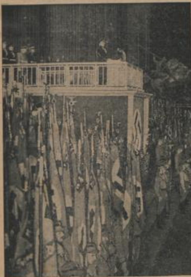
Generalfeldmarschall Hermann Göring sprach im Berliner Lustgarten