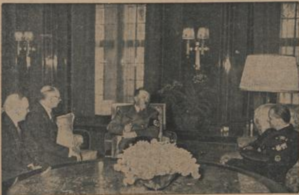
Der ungarische Staatsbesuch beim Führer Links: Ministerpräsident Graf Teleki, rechts: Außenminister Graf Ciano.