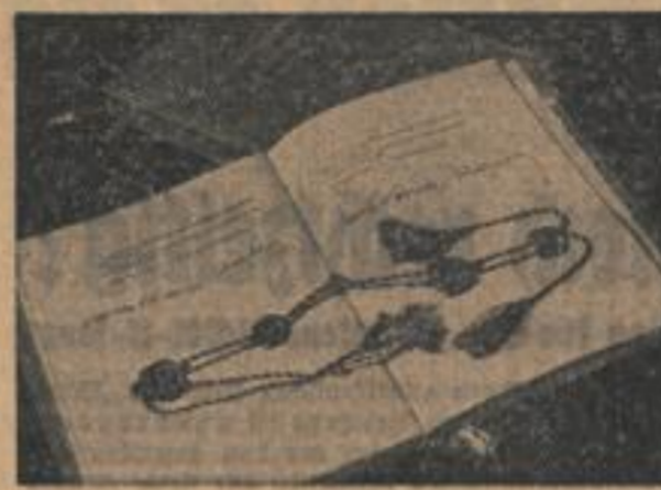
Ein historisches Dokument

Im Zusammenhang mit der Unterzeichnung des deutsch-italienischen Freundschafts- und Bündnisvertrages sind Darlegungen von besonderem Interesse, die die Zeitschrift „Die Wehrmacht“, herausgegeben vom Oberkommando der Wehrmacht, über den Aufbau des Oberbefehlshabers des Heeres bei den Soldaten des Imperiums veröffentlicht.