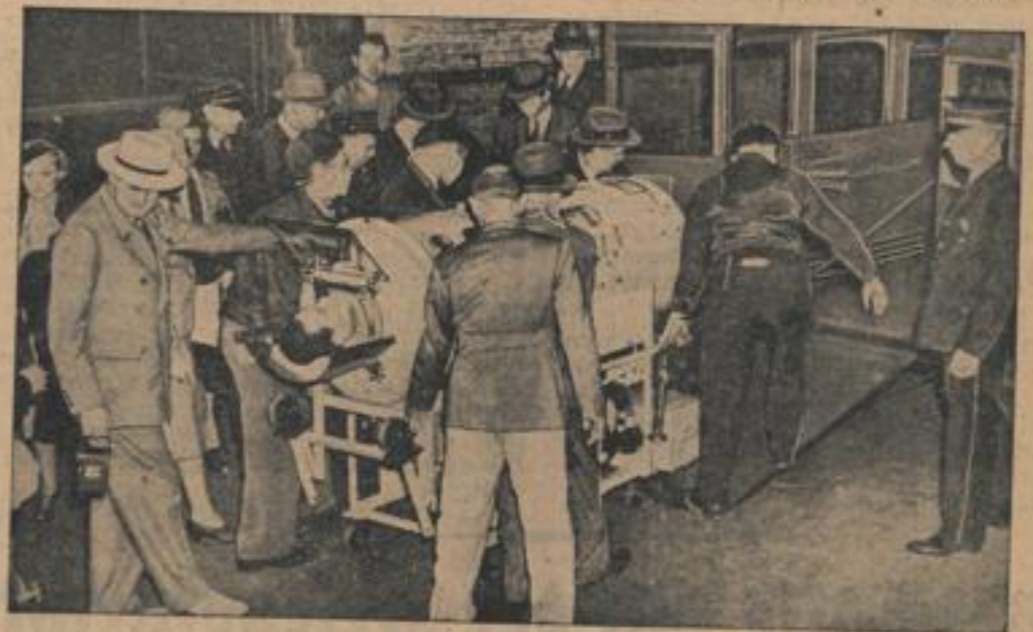
Jetzt soll Lourdes helfen

Japan wurde am 6. Mai von einer riesigen Erdbebenkatastrophe heimgesucht. Es bildeten sich im Ozeanboden Spalten, in denen ganze Häuser verschwanden. Viele Erdbeben wurden vollkommen zerstört. Unser Bild zeigt die Trümmer von drei Reisfahnenmasten in Fukuoka-machi.