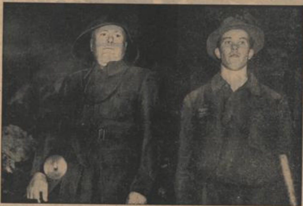
Der Duce besichtigt ein Bergwerk

Zum Abschluß seiner Reise durch Piemont stattete der Duce den Bergwerken von Coyne bei Noto einen Besuch ab und fuhr selbst in das Bergwerk ein.