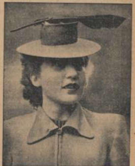
Wie ein Linienschiff

Ein Bild aus dem Streikgebiet in Paris im Jahre 1926. Nationalgarde mit leichten Maschinengewehren wurde aufgeboten, um die Bergwerke zu schützen.