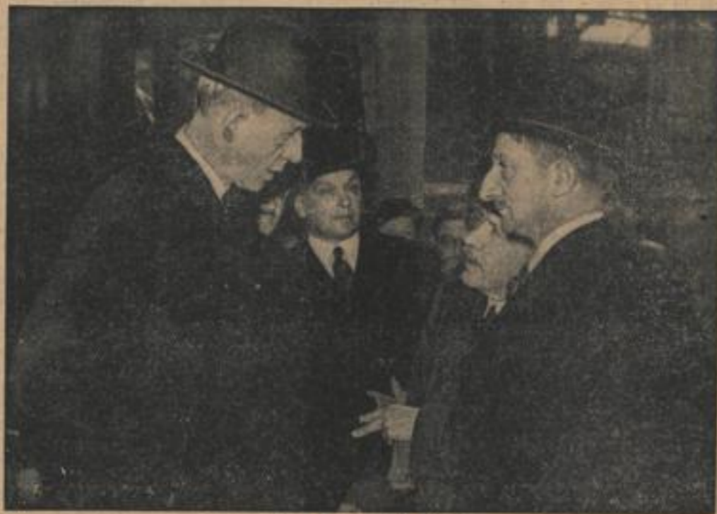
Lord Halifax in Paris

Am 21. Mai 1431 wurde in Rouen die Asche der heiligen Johanna nach der Hinrichtung in die Seine geschüttet. An derselben Stelle werden in jedem Jahre Mädchen Blumenkränze in den Fluss, um die französische Nationalhelden zu ehren.