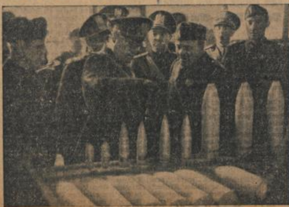
Der Duce bei der Besichtigung einer Munitionsfabrik in Alexandria in der Nähe von Tunis.

sehen die Gebrüdertruppe. — Alpi — und vor allem die schnellsten Verläufer, in deren Reihen einst der Duce gedient und gekämpft habe.