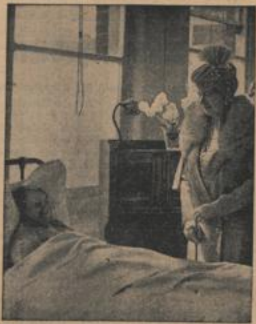
Königin Mary im Chelsea-Hospital

200 000 Mann aller Waffengattungen waren an der großen Siegesparade in Madrid beteiligt, die über fünf Stunden dauerte. Unser Bild zeigt motorisierte Einheiten der italienischen Freiwilligen die über Blumen vor Francos Ehrentribüne vorbeifahren.