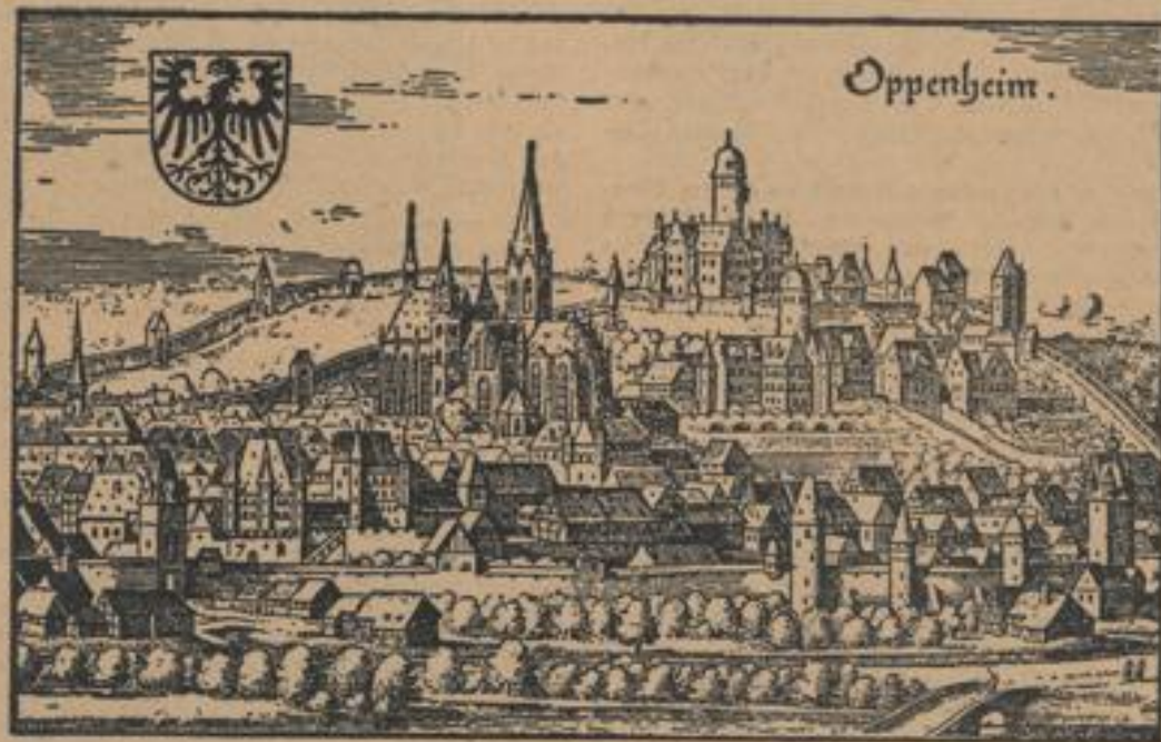
Oppenheim um 1620, nach dem Stich von Merian (Maler: Evng. Volksverein.)