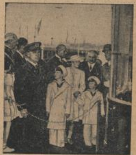
König Leopold eröffnete die internationale Ausstellung „Wasser“ in Lüttich

Der britische Außenminister Lord Halifax verließ diese Tage mit seiner Begleitung in Paris. — Von links nach rechts: Lord Halifax im Gespräch mit dem englischen Botschafter in Paris, Sir Eric Phipps, und dem französischen Außenminister Georges Bonnet auf dem Nordbahnhof in Paris.