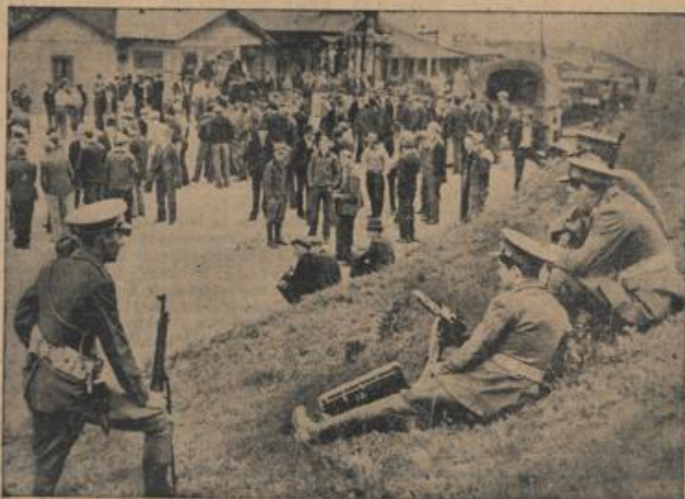
Maschinengewehre gegen streikende Arbeiter

Königin-Mutter Mary eröffnete in der Krankenhaus in London den Erweiterungsbau des Chelsea-Krankenhaus. — Unser Bild zeigt Queen Mary bei der Unterhaltung mit einer Patientin. (Associated Press, Sonder-Nr.)