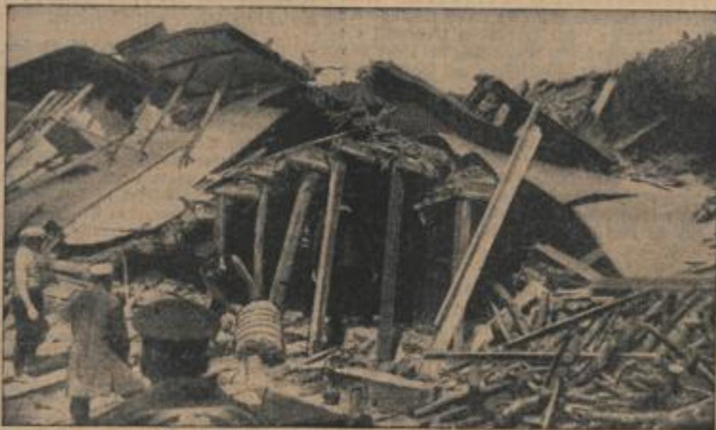
Wenn die Erde bebt

Ein ergriffener Gut, der auf einer Jagd in der berühmten Londoner Gesellschaft St. Marys in Westminster zu sehen war.