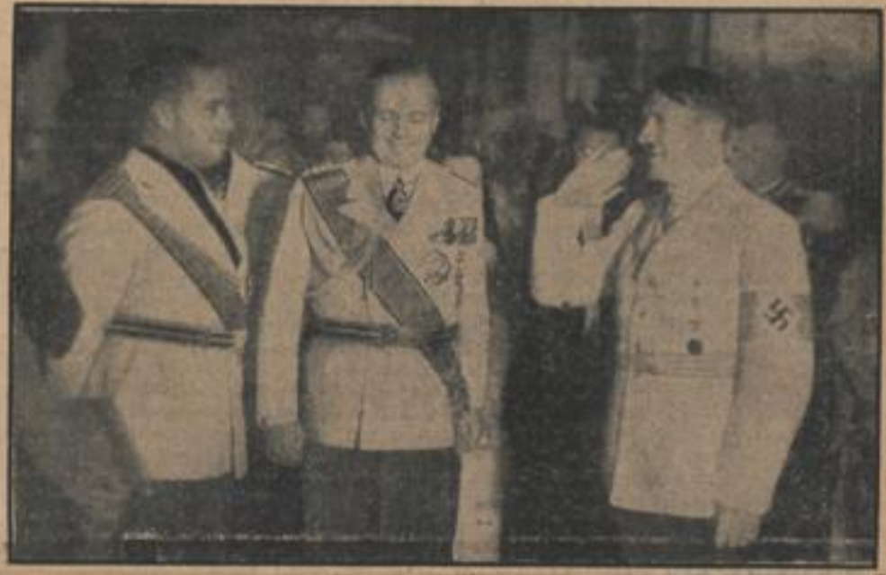
Mit einer Wendetafel, die der Reichsminister des Auswärtigen, von Ribbentrop, in seinem Hause in Berlin im Ehren seines Besuches aus, wurde der Aufenthalt des italienischen Außenministers Graf Ciano in Berlin beschlossen. — Italiens Außenminister Graf Ciano, Reichsaußenminister v. Ribbentrop, der Führer.

mouth gesunkenen amerikanischen U-Bootes „Squalus“ eingeschlossene Besatzung ist unverändert ernst. Sämtliche Sender der drei amerikanischen Rundfunkgesellschaften verbreiten alle halbe Stunde lange Berichte über die Lage der U-Bootleute und das Fortschreiten der Rettungsaktion. Nach dem Eintreffen an der Unfallstelle wird der Bergungsdampfer sofort verladen, Verbindungskabel an die für Unglücksfälle vorgesehenen Versuchsaufbauten des U-Bootes anzubringen, um auf diese Weise Luft und Nahrungsmittel in das Boot hineinzubringen. Durch Herstellung eines Ueberdrucks im Innern des U-Bootes hofft man auch, das Boot sofort freizubekommen. Sollte das nicht gelingen, wird man versuchen, durch die eisernen Bergungsbalcke die eingeschlossene Besatzung in Gruppen von sechs bis acht Mann an die Oberfläche zu bringen. Sollte auch das fehlschlagen, wird man den Versuch zur Anlegung der Bergungsaufbauten, einem Sauerstoffgerät, das außer für die Atmung auch für den notwendigen Auftrieb sorgt und die Anordnung: „Setze dich wer kann“ geben. Da das U-Boot jedoch in einer Wassertiefe von etwa achtzig Metern liegt, besteht wenig Hoffnung, daß die U-Boot-Männer auf diesem Wege ohne gesundheitliche Schäden die Oberfläche des Meeres erreichen.