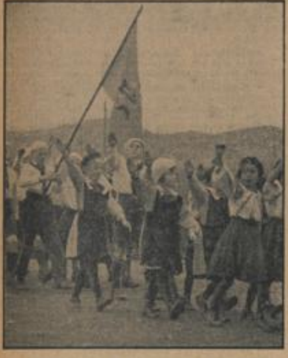
Dienstpflicht für die rumänische Jugend