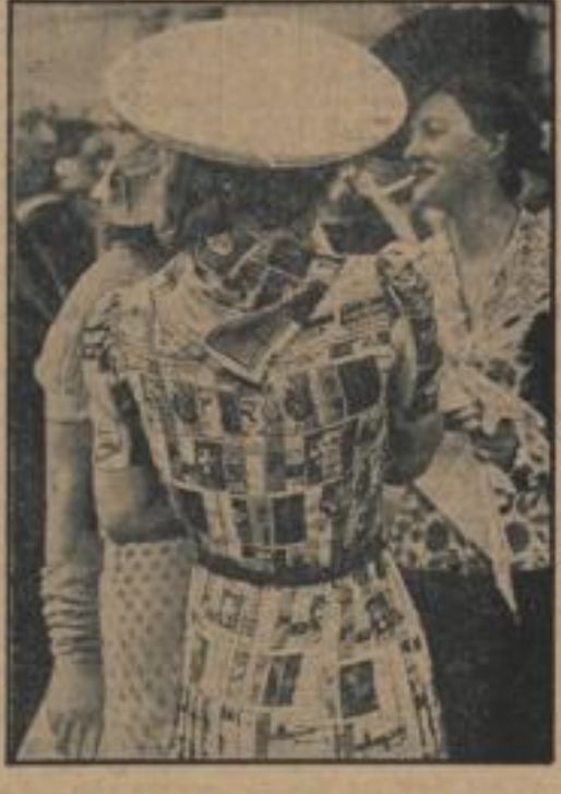
Der 'letzte Schrei' aus Paris