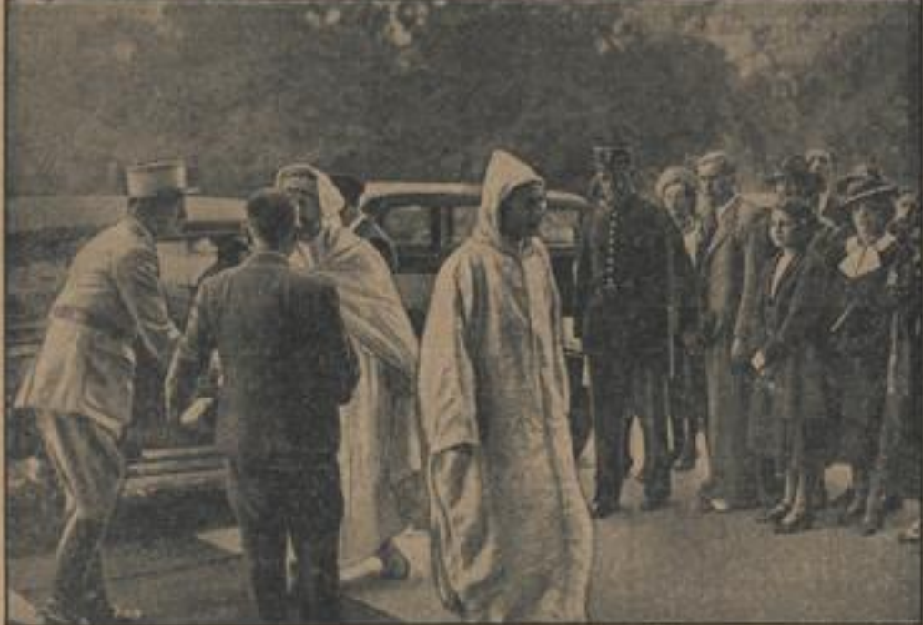
Der Sultan von Marokko in Paris