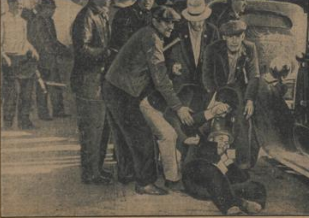
Ein Bild, das in Amerika alltäglich ist

Unter den kühnsten Tennisturnieren hat das internationale Mannheimer Tennisturnier seit altersher einen ganz besonders guten Klang.