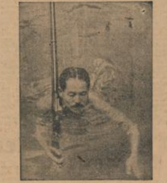
Kämpferisches Japan Samurai-Kämpferinnen mit Gewehr