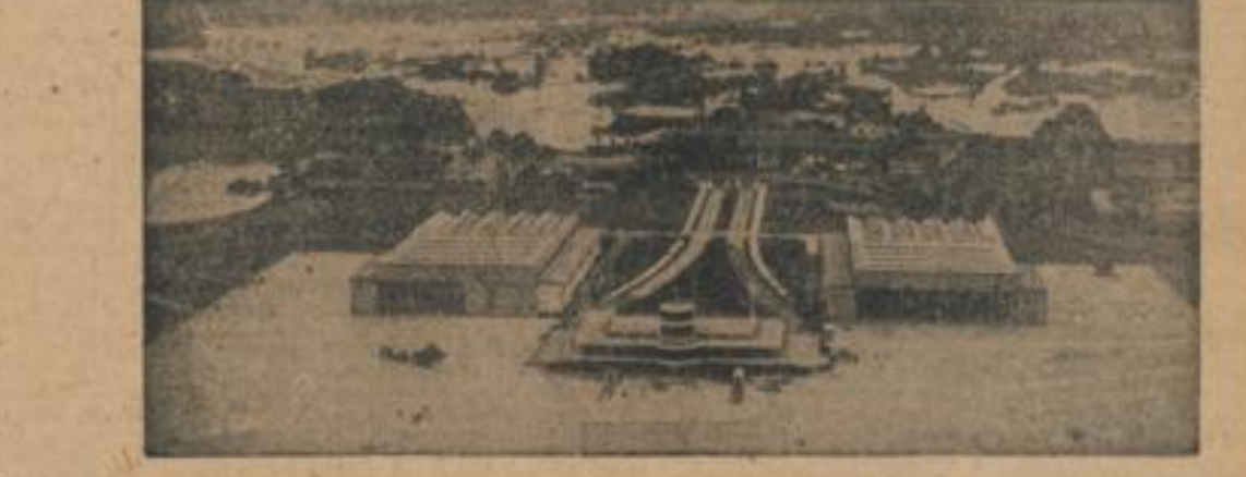
Der Flughafen Singapur, der beim Angriff der Japaner auf die Insel ebenfalls in Mitleidenschaft gezogen wurde...