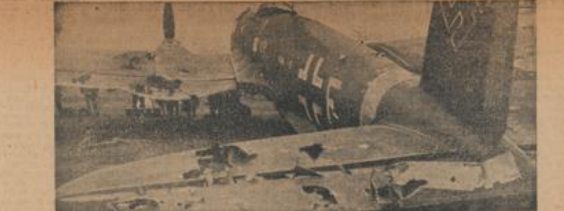
Trotz schwerer Flaktreffer zurückgekehrt Nur das Können des Flugzeugführers und die Güte des deutschen Materials ermöglichten die Rückkehr...