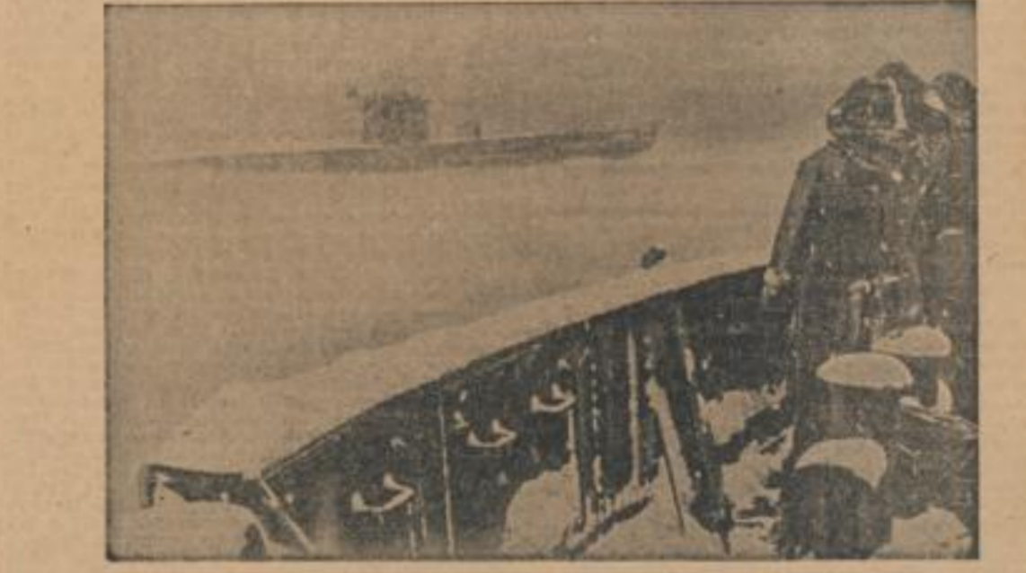
Harter Dienst auf See im Winter Ein Bootschütz der Kriegsmarine und ein U-Boot-Besatzungsmitglied...