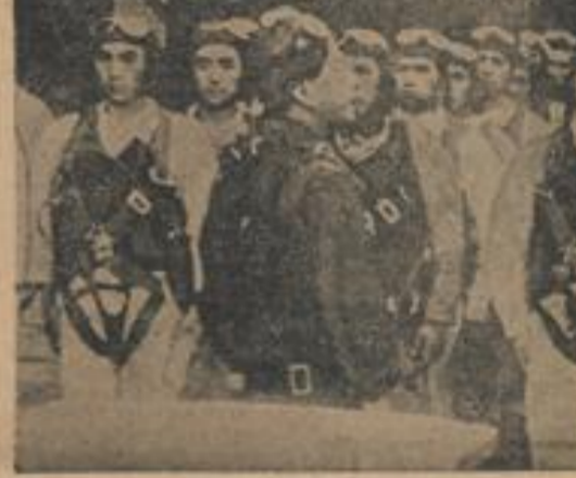
Japanische Fallschirmjäger bei der Entgegennahme eines Einflugbeschießes...