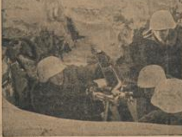
Ein schwerer Granatwerfer in Feuerstellung