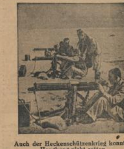
Auch der Heckenschützenkrieg konnte Hongkong nicht retten