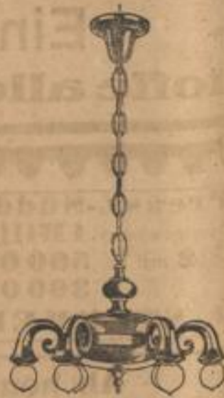
Gedieg. Herrenzimmerlampe schwere Ausl., echt Bronze, 6 Flammen 125.-

Sie finden bei uns 50 verschiedene Salonlampen in den gediegensten Ausführungen.