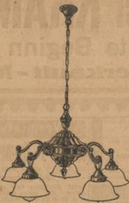
Salonlampe echt Bronze mit 5 Flammen, sehr preiswert 58.-