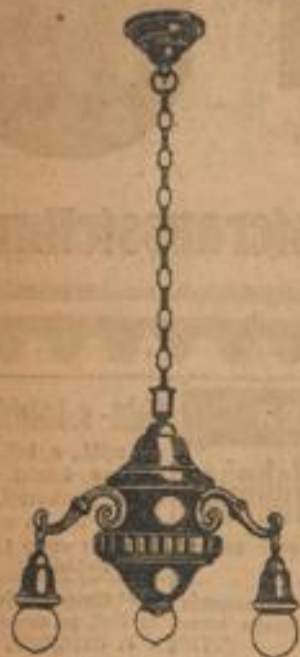
Herrenzimmerlampe echt Bronze, schwere Qualit. m. 3 Flammen 70.-