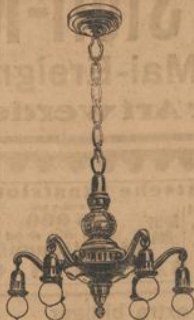
Herrenzimmerlampe reich verziert, echt Bronze, 6 Flammen 98.-