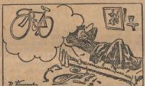
Qualität, Sicherheit und Zuverlässigkeit. Die besten Fahrräder...