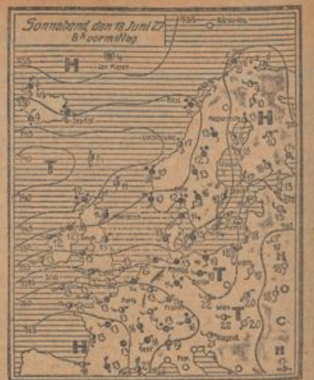
Weiteren Nachrichten der Reichsruher Landeswetterwarte