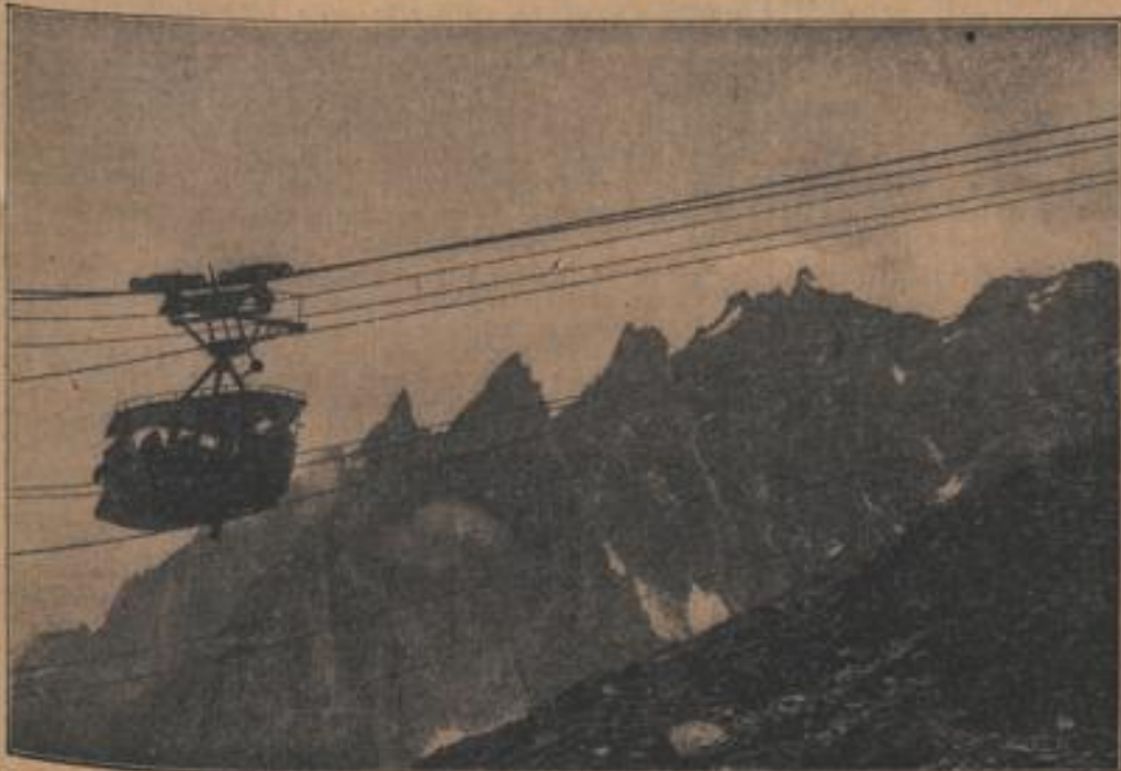
Der erste Wagen auf der Fahrt