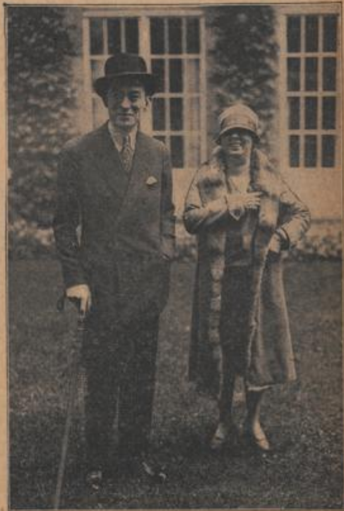
Der Oberbürgermeister Newyorks, Walker, und seine Gemahlin