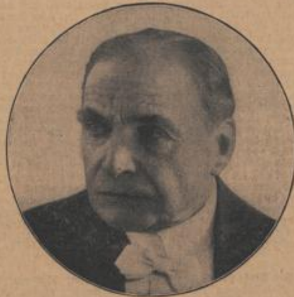
Albert Bassermann, der große deutsche Schauspieler wird in diesen Tagen 60 Jahre alt