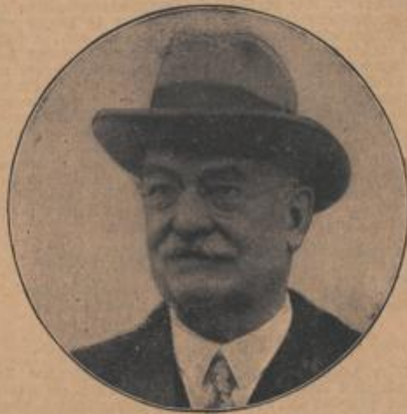
Geb.-Rat Dr. Karl Duisberg, der bekannte Großindustrielle