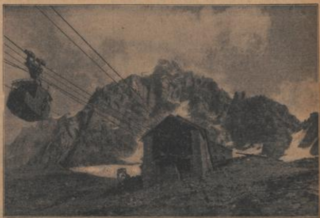
Station in 2664 m Meereshöhe. Im Hintergrund die Spitze des „Aiguille du Midi“ Atlantic Paris