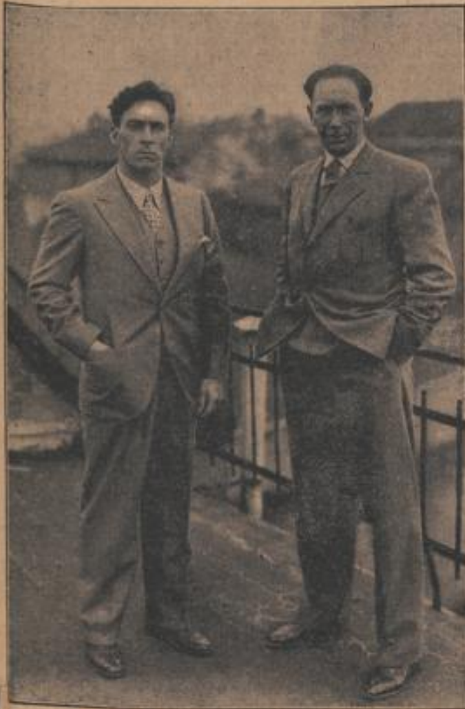
Der amerikanische Filmheld O'Brien (links) und der bekannte Filmregisseur W. Murnau