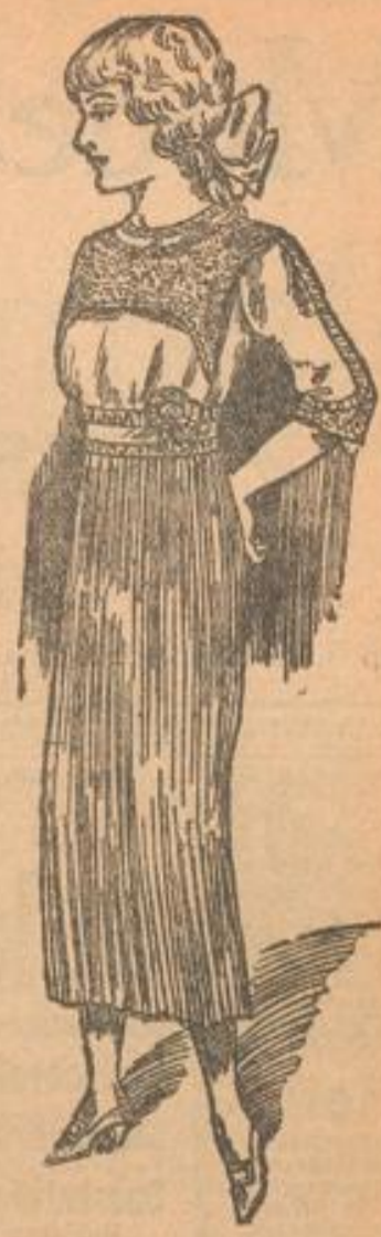
Kommunikationskleid aus weichem Voile, mit plissiertem Rod u. großem Spitzenträger.