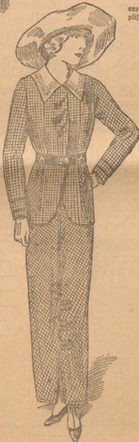
Frühjahrskostüm aus schwarz-weiß farbigem Wolstoff mit Gürtelkade und großer Hemd.

dem. Die Bordürenstoffe, wie Musselin mit Fiselbordüren, sehen allerseits aus. Zum Sommer werden wieder viel Blusen getragen werden. Bunte, bulgarische Seidereien in grellen Farben, sieht man an eleganten Kleidern, sowie auch an einfachen Blusen. Die zu verarbeitenden Spitzen sind leicht. Fiselstoff mit kleineren Mustern verarbeitet man zu den eleganten Nachmittagsblusen. Straf- und Verführereien sieht man jetzt sogar an Nachmittagskleidern. Die Mäntel sind aus gerauten Stoffen zu arbeiten, \frac{3}{4} lang und vorne abgerundet. Noch einige Worte über die „Hutfrage?“ Vorläufig heißt es „nur keine Hüte“ — und hat man hierin ja eine Riesenauswahl der entzückendsten Modelle geschaffen. Ich sah schon entzückende schwarze Hüte aus Fedalstroh mit Tüllschirmen mit Reihengesteck tragen; in den Pariser Ateliers schon Hüte in den herrlichsten Farbensammlungen, z. B. marine Fedalstroh sehen, braune — Königsblau mit Garnierung in alle Nuancen. Auch zweifarbige Hüte werden im Sommer recht beliebt werden. Kleine Rosengirlanden, Bandtschlappen, Reiser und Federn in allen Farben und Preisen sorgen dafür, daß unsere Damen sich der Mode entsprechend kleiden können. L. R.