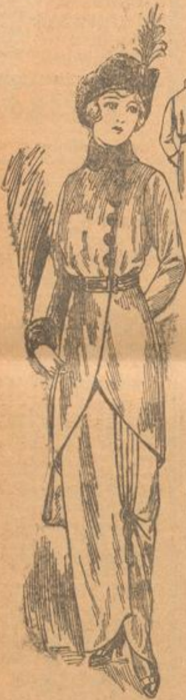
64509 & 64611

dope marineblaue Rock ist auch hier ein liebes Möbel, zu dem jedwede bunte Jacke paßt. Moderner als er sind Röcke in lebhafteren Farben, vor allem solche aus Engadiner Loden, zu denen man Jacken aus demselben Stoff trägt, oder gewirkte in der Farbe passende Jacken, die nach wie vor auf dem Wintersportplatz die gleiche Wichtigkeit behalten. Die Kostüme aus dem besagten Loden-