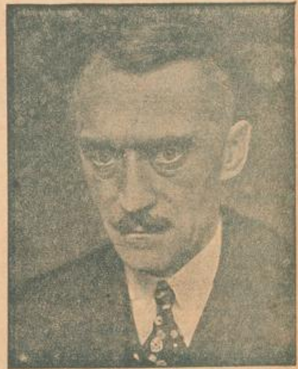
Der Schriftsteller Leonhard Frank