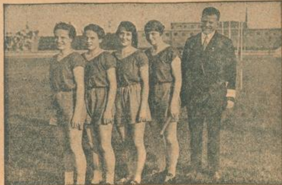
Die deutsche Weltrekordstaffel: Die siegreichen Mitglieder der Viktoria-Magdeburg