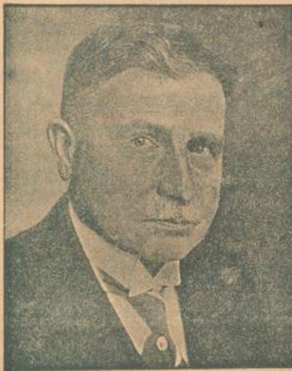
General Wilhelm Groener, der neue Reichswehrminister