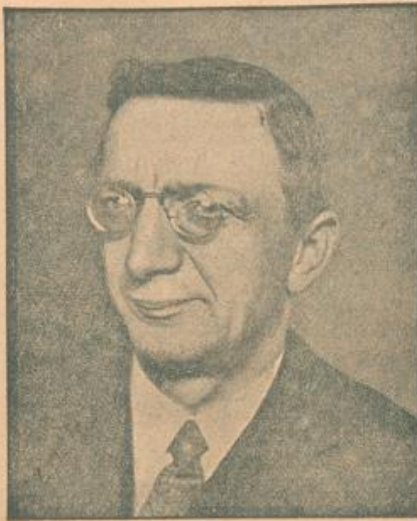
Der Romanschriftsteller Alfred Döblin