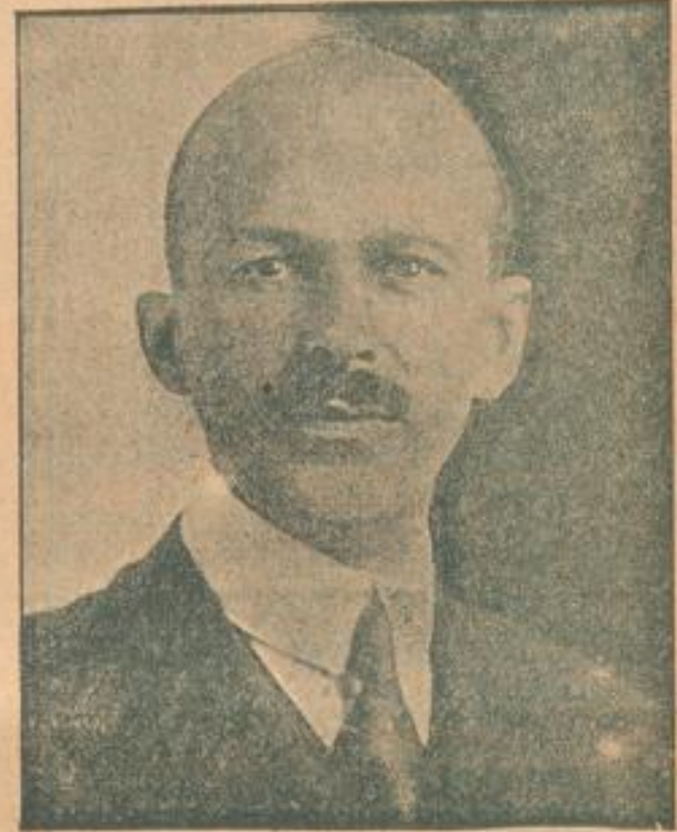
Dr. Alfredo Pirelli, der Präsident der international Handelskammer in Europa