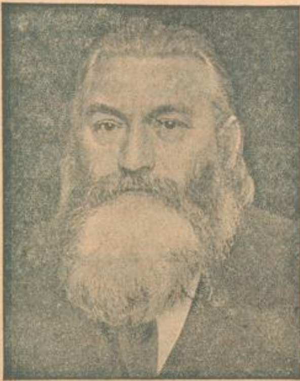
Der Dichter Theodor Däubler, Deutsche Presse-Photo-Zentrale Berlin.