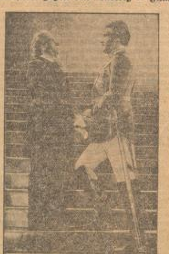
Kauf des Kaiserpalastes, Ludwig II.: Königin Luise II. (Wilhelmine Dieler) und Kaiser Wilhelm II. (Hilmar) im Hintergrund.