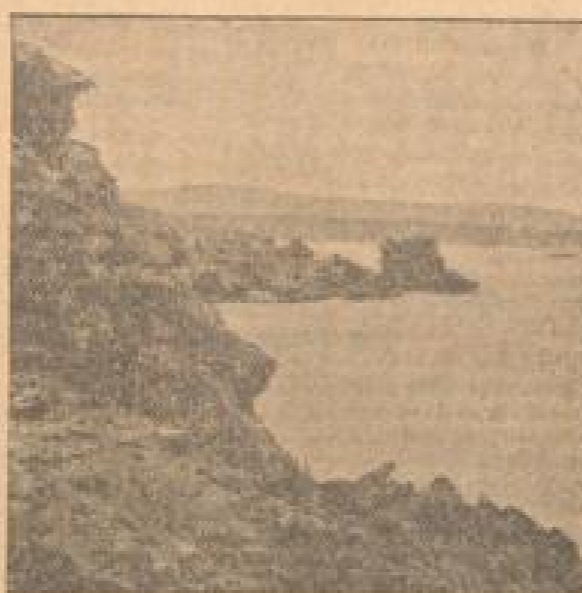
Bild der Gruppe der Galapagos-Inseln. Bild auf die Insel Isabela, von einer Wacht der Expedition aus gesehen.