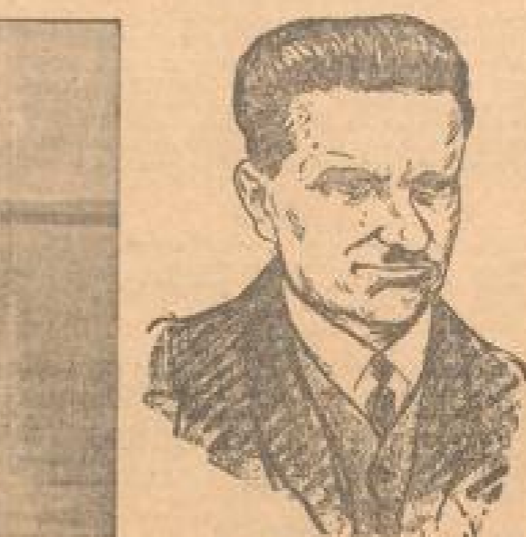
Dr. Carl Ritter aus Berlin