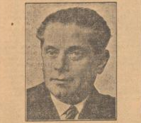
Prof. Max Reinhardt, einer der bedeutendsten Theaterregisseure in der deutschen Theatergeschichte, übernahm vor 25 Jahren als Nachfolger Otto Brauns das Deutsche Theater in Berlin, das unter seiner Leitung zum vornehmsten deutschen Schauspielhaus wurde.