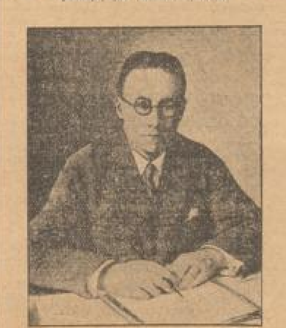
Der hiesige Generalintendant des Berliner Opern ...