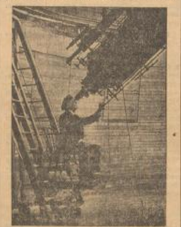
Der verlebte Astronom Percival Lowell am

den Nachrichten von der Entdeckung sehr kritisch.