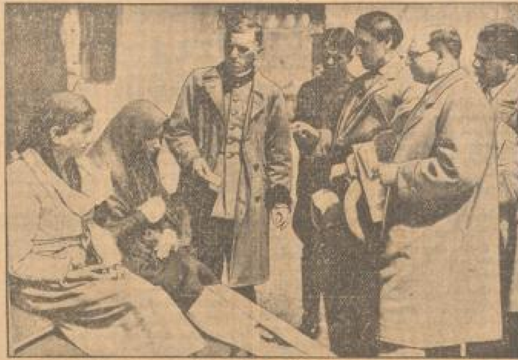
Bei dem hundstündigen Brandanschlag von Costesti in Rumänien sind 140 Mitglieder des Karfreitagsgottesdienstes zum Tode gekommen, konnten nur zwei Mädchen gerettet werden, die unter den Trümmern begraben und so von den Flammen nicht erfaßt worden waren.

brannt. Da die ganze Gemeinde Costesti nur 100 Familien zählt, hat jede Familie mehrere Tote zu beklagen.