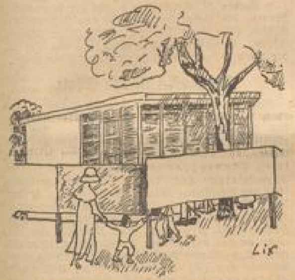
Mannheim-Afrika hinter der Schutzwand. Die Löwen werden beschützt.

Man kann lange fern sein, aber man kann auch... (Text contrasts physical distance with emotional presence.)