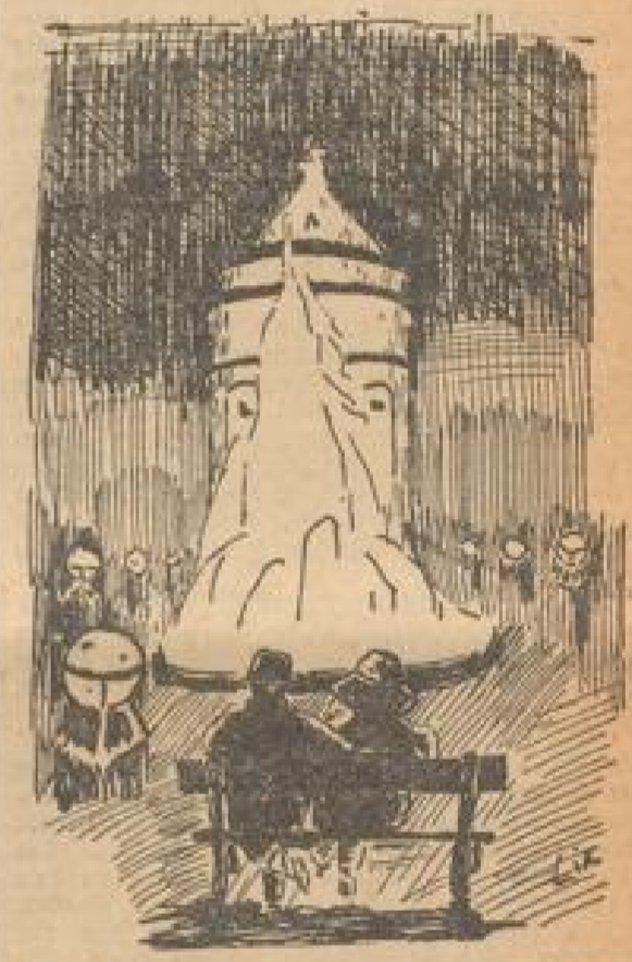
Der Mannheimer öffentliche Kurpark: Ferienzauber an der Leuchtfontäne

Ob das nicht wirklich wunderbar?... (Text reflects on the joys of home life.)