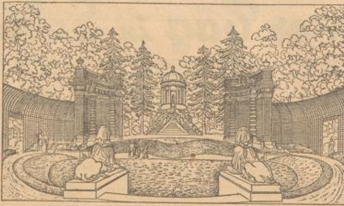
Der Apollo-Tempel im Schwetzinger Schlossgarten