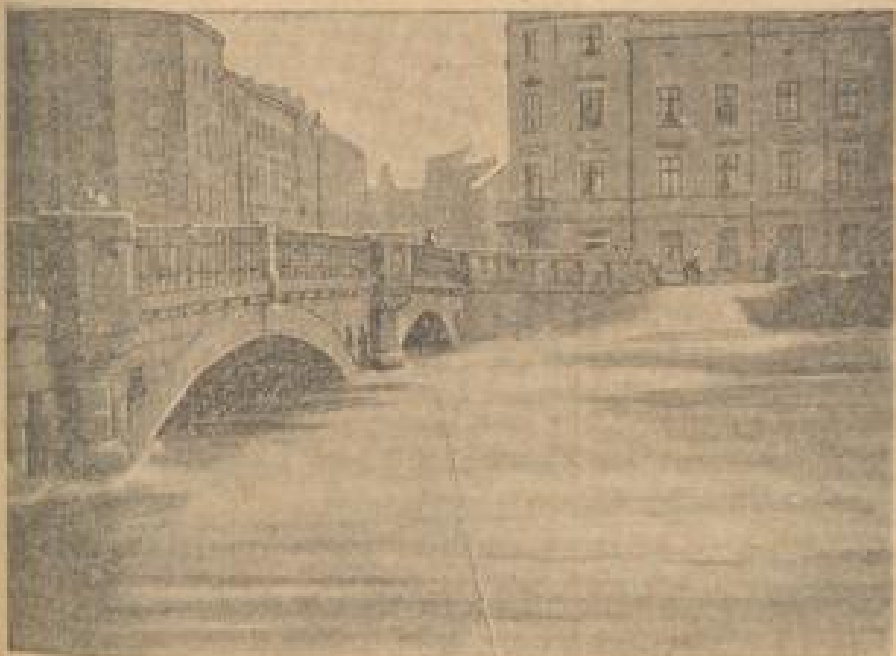
Die reizende Regbahn bei Legnica

Reife steigt erneut an, und zwar handlich um 1 bis 2 Zentimeter. Auch von Jitsau wird weiterer Steigen des Pegelstandes gemeldet. Im Riesengebirge ist ein Temperaturrückgang eingetreten. Im Ostschlesien beginnen die ungewöhnlichen Schneemassen zu schmelzen und im Tal regnet es. Die Hochwassergefahr verstärkt sich dadurch natürlich in bedrohlichem Maße.