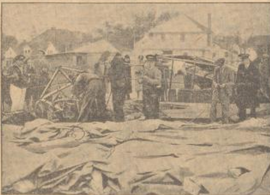
Der explodierende Motor und die zertrümmerte Gondel der Luftnacht. Nur die Gashöhle (im Vordergrund) blieb unversehrt.

Die erste Explosion der Welt, die von dem Erfinder des Autos konstruiert wurde, explodierte bei Tausend Meilen (Paris-Test), wobei 1 Verlesene 12 Motor weit geschleudert und schwer verletzt wurden.