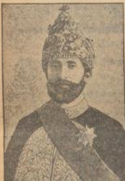
Ras Tafari Makonen

Er galt als der zukünftige Erbe des Thrones, aber es kostete ihn eine ganze Reihe von Kämpfen, ehe er das Ziel erreichte, vor dem er heute steht.