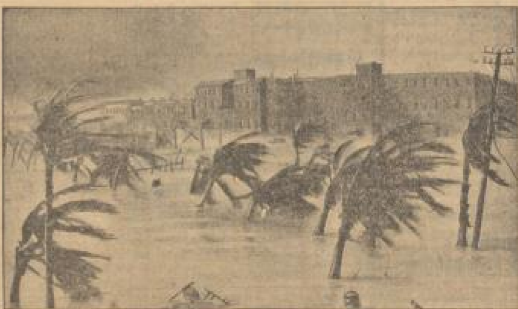
So leben alljährlich zur gegenwärtigen Jahreszeit die Einwohner über die Cüste der Inseln des Indischen Ozeans. Unter Bild zeigt die Palmenallee einer vornehmen Kolonialstadt nach einem heftigen Sturm (Orkan). Die Bäume zeigen nur noch ihre stielähnlichen Äste und den Stamm.