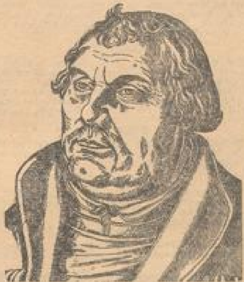
Martin Luther nach dem Holzschnitt von Lucas Cranach.

In äußerem Jubel ist kein Klang. Auch das kirchliche Deutschland weilt von Schmach und Schmerz. Und der Protestantenbund, der heute der großen, lebensmächtigen Vergangenheit denkt, steht sich täglich immer mehr hintergestellt in den Kampf um Recht und Sein. Das Sein bedroht ihn „der alte böse Feind“, der im großen Verweltlichungsprozess der Gegenwart die alte Kirche erneuert und ankämpft, wüthend und selbstbewußt, gegen alles, was kirchlich und christlich ist. Und das Volk steht ihm gegenüber und jene, die den Reformator verwarfen