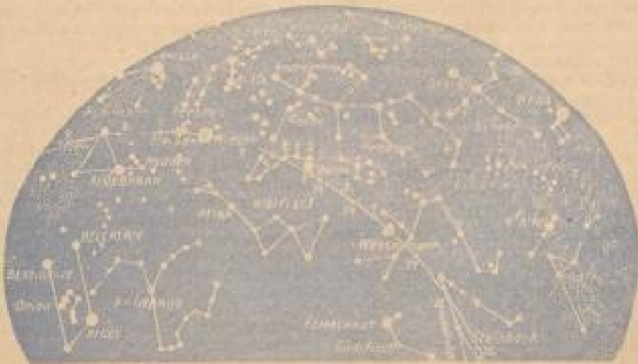
1. Orientierung nach Süden

Jupiter leuchtet als heller Stern des ganzen Nachthimmels im Sternbild der Zwillinge. Er geht Anfang des Monats 4, Ende des Monats 3 Stunden nach Sonnenuntergang auf. Ihm folgt in 1-2 Stunden der Mars.