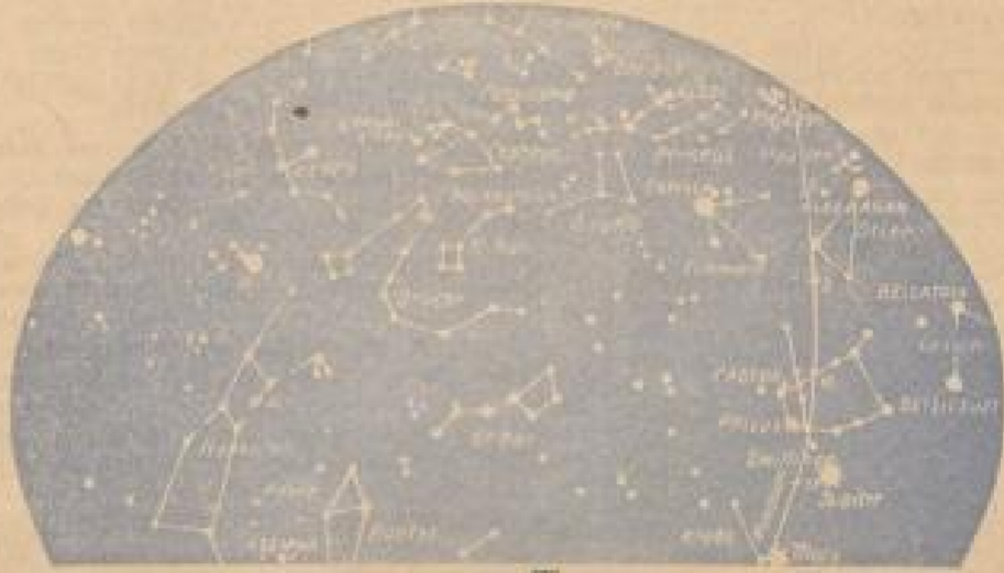
2. Orientierung nach Norden