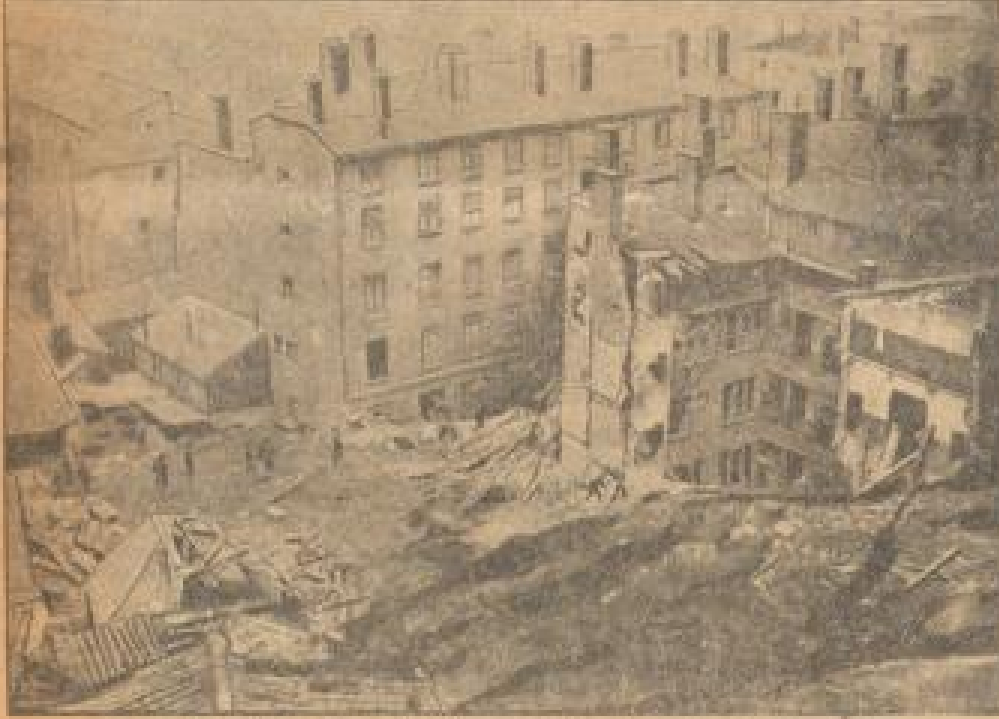
Uebersicht über die Grauenstätte im Viertel Jouxviere

Dort glitt am 2. September 1903 ein vier Kilometer langer, über 90 Meter breiter und dreihundert Meter