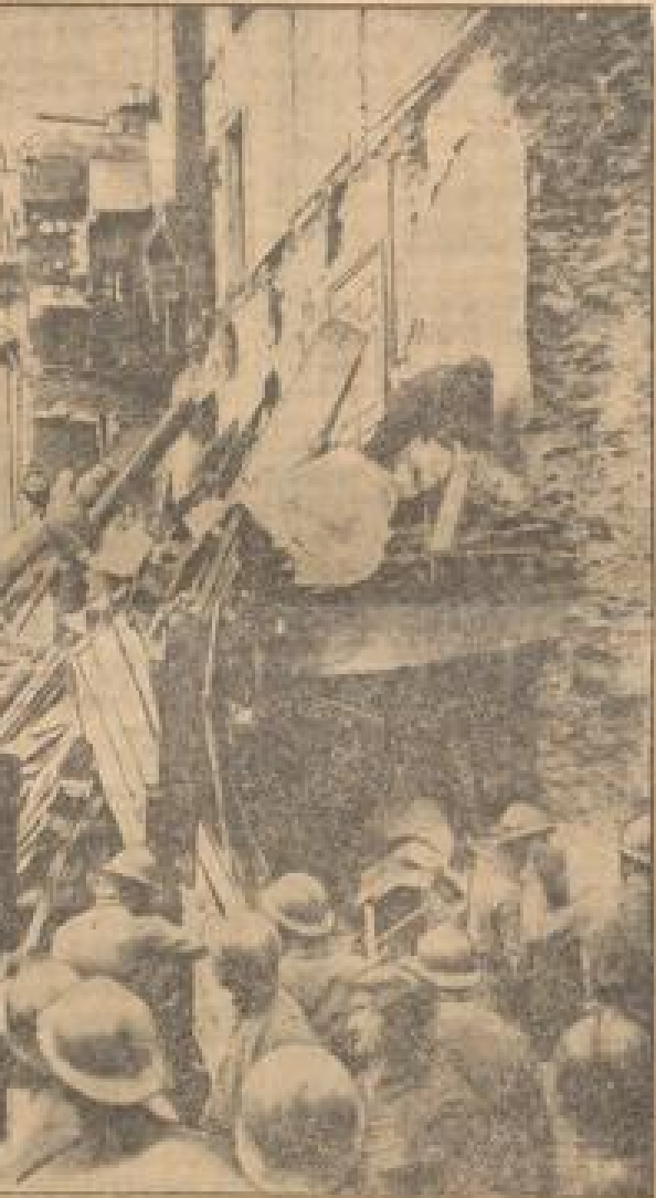
Militär leitet die ersten Rettungsarbeiten