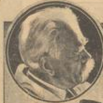
Die Wolkenkratzer von New York; im Mittelpunkt der riesige Chrysler-Wolkenkratzer. Links oben: Der Architekt Bunting