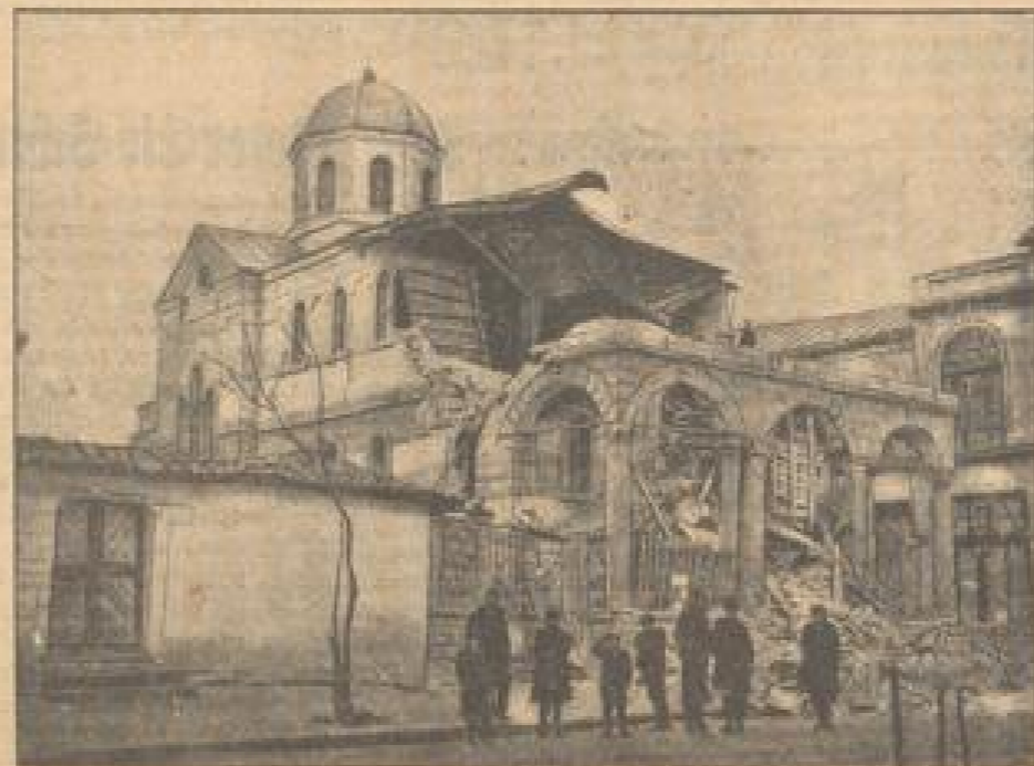
Die eingestürzte Kirche der Stadt Korischa in Albanien aus viele hundert Personen bei dem schweren Erdbeben getötet werden.

daneben besteht zu halten, sondern man konnte nur gelegentliche Ausfahrten von Minen- oder Torpedobooten unternehmen lassen. Erst im Herbst 1904 konnte ein früheres Minenboot von nur 800 Tons Größe und 14 Seemeilen Geschwindigkeit, das 1918 erbaut und dann für einen neuen Zweck umgebaut worden war, für den Fischereischutz in Dienst gestellt werden. Es erhielt in seiner Erbauungszeit an die Verbands des alten "Vieten" wiederum diesen Namen.