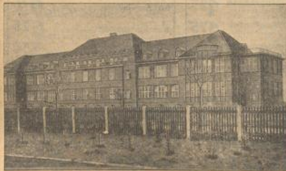
Das Staatshospital in Guxhaven

versorgt jetzt Schiffe auf hoher See in Fällen von epidemischen Erkrankungen mit ärztlicher Beistand, die den Schiffen drachlose leistend sind. Besonders für kleinere Schiffe, die keinen Arzt an Bord haben, ist diese Dienstleistung von großem Wert, wenn die Patienten außer in Deutsch- auch in Englisch, Französisch und Spanisch sprechen können.