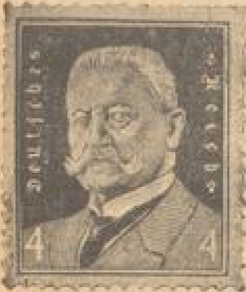
Die neue 4 Pfennig-Beiermarke der Reichspost, die anlässlich der Beierhebung des Bundespräsidenten zur Ausgabe gelangt, trägt das Bild des Reichspräsidenten von Göttingen.

schweren Schussdienst verfügbaren Schiffe unter der Reichsflagge.