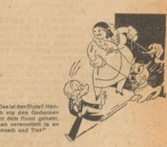
Das Olmün, das auf den Grund kommt! Eine Geschichte in sieben Fortsetzungen