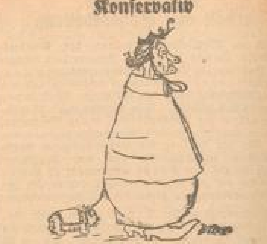
„Schredlich, was die Leute jetzt wieder für neue Götze brauchen — ich hab' meinen schon zwanzig Jahre und er ist noch nicht kaputt!“