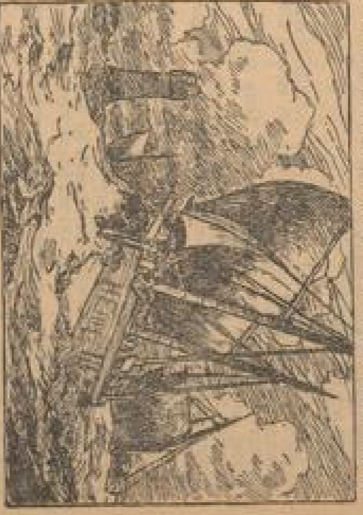
Inseldorpfen in der Nordsee

Die Inseln sind kleine, einsame Inseln, die in der Nordsee liegen. Die Inseln sind kleine, einsame Inseln, die in der Nordsee liegen. Die Inseln sind kleine, einsame Inseln, die in der Nordsee liegen.