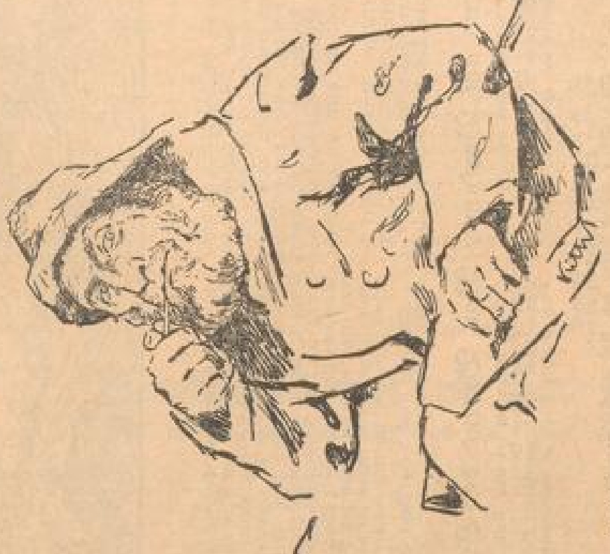
Der alte Seemann

Die Nordsee ist eine Mordsee genannt; das ist sie im schiffsmännlichen Sinne des Wortes. Nicht nur das Wellenrauschen, das man hört, wenn man in der See ist, es ist auch das Geräusch der Wellen, die auf die Klippen schlagen, das ist es, was die Nordsee so gefährlich macht. Der Seemann, der die Nordsee durchkreuzt, ist in der Gefahr, von den Wellen über Bord zu gehen. Die Nordsee ist eine Mordsee, weil sie so viele Menschenleben gefressen hat.