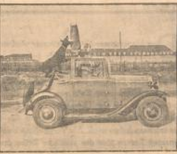
Kara bei der Arbeit

der Sparsarbeit an, Sparsachen, verloren, verheiratete