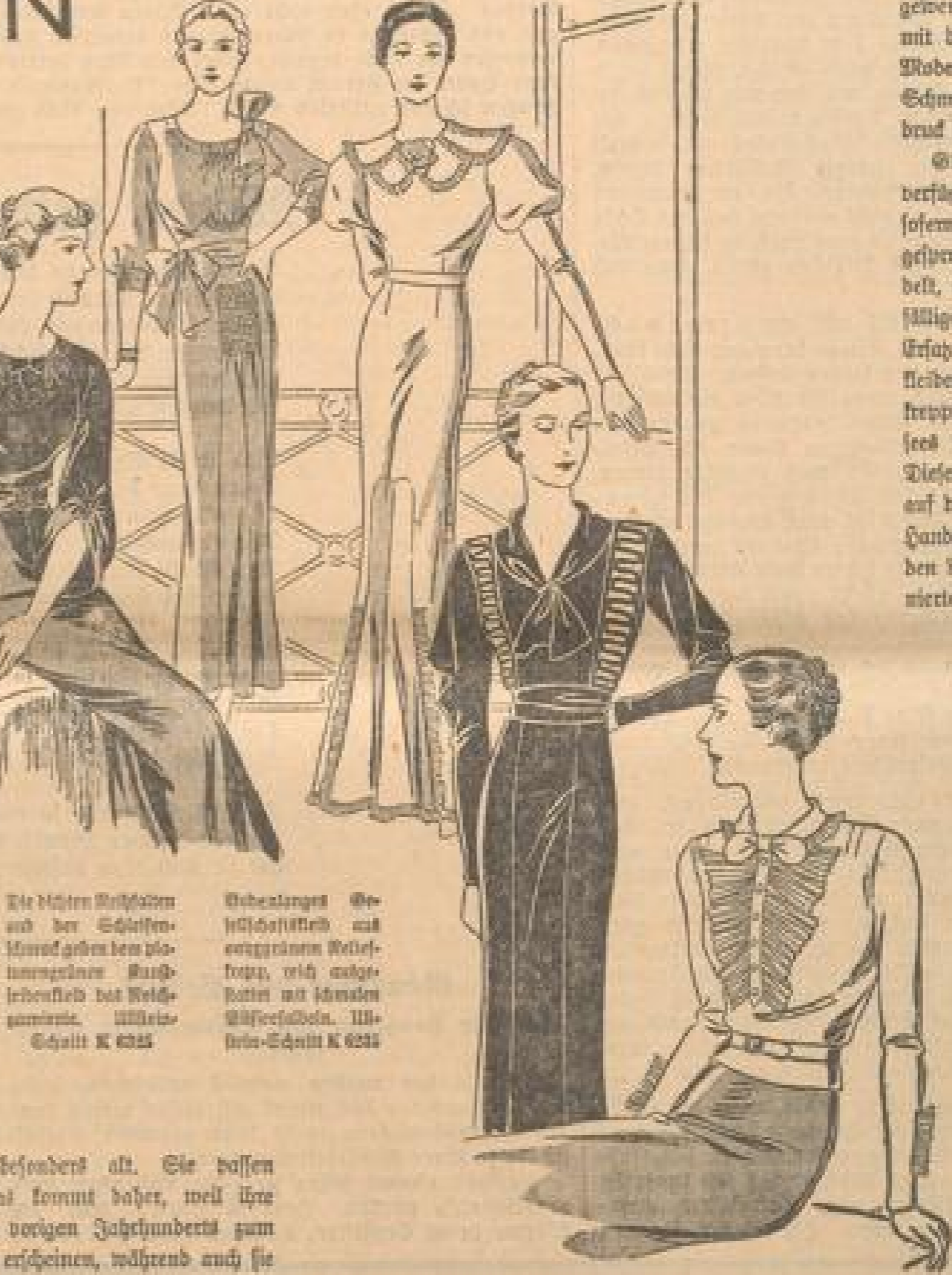
Die Hüften schmücken sich mit eleganten Garnaturen, die den platonischen Körper mit feinsten Stoffen schmücken. Stoff: Wolle-Schell K 6255