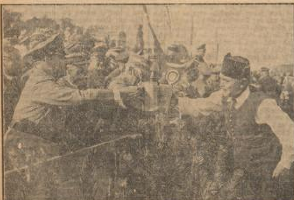
Die bayerische Regierung auf dem Feldtag.