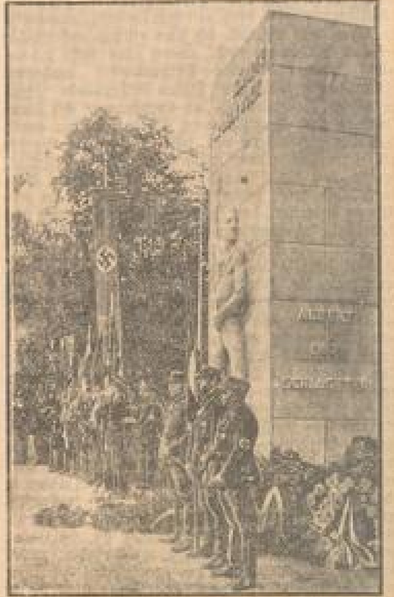
Ein Bild von der Weise des Toten, das, wie bereits berichtet, anlässlich des Schwabenschlachten Gedenktages in Karlsruhe für den bayerischen Reichskommissar errichtet und jetzt im Besitz der badischen Regierung ist...