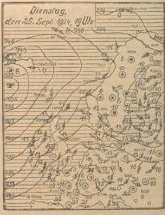
Wetterkarte der Rhein- und Neckarregion. Die Karte zeigt die Temperatur in den verschiedenen Teilen des Landes...

Wetterkarte der Rhein- und Neckarregion.