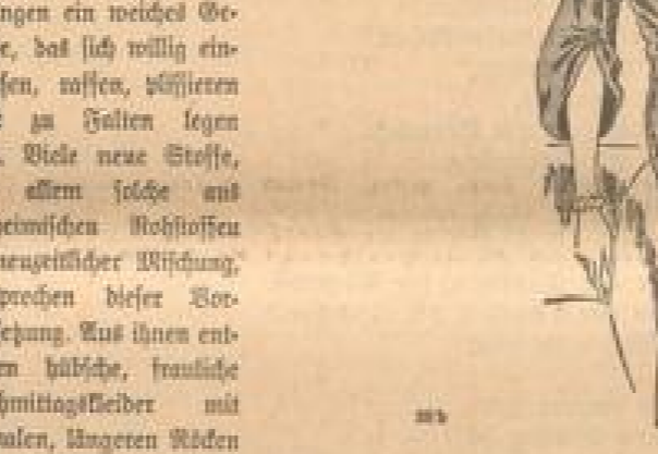
In einer neuen, an Gold und den feinsten gezeichneten Form mit Knöpfen und Knöpfen. Stoff: Wolle-Schell K 6253