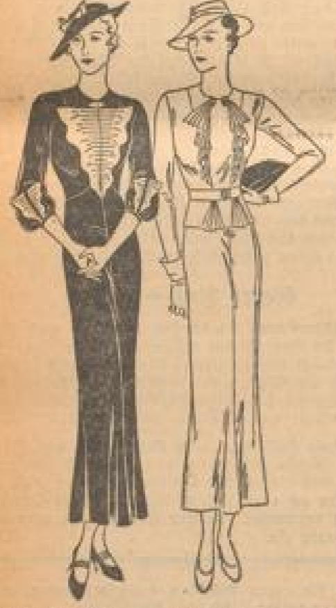
Reiches Kleid in einem weichen Stoff, garniert mit schmalen Schößen. Stoff: Wolle-Schell K 6254

Die Schneiderinnen haben es heute leicht, jedes Kleid anders zu machen, als das vorige. Durch reiche Garnierungen bietet die Mode jetzt Abwechslung, doch für die größte Verschönerung ist gefordert. In reichlicher Weise bringt man überhaupt weiche fällige Knocnungen an, deren Zweck nur darin besteht, die hundertprozentige Weichheit in unserer Kleidung zu vollenden. Es sind zum größten Teil aus dem Kleiderstoff selbst gewonnene Garnaturen. Sie bedingen ein weiches Gewebe, das sich willig einknäulen, raffen, wölben oder zu Falten legen läßt. Viele neue Stoffe, vor allem solche aus einheimischen Rohstoffen in neuzeitlicher Wirkung, entsprechen dieser Voraussetzung. Aus ihnen entstehen hübsche, fröhliche Nachmittagskleider mit schmalen, längeren Rücken und einfallend gearbeiteten Oberteilen.