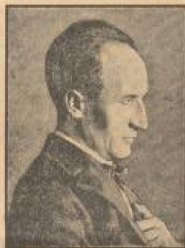
Der Dichter Hanns Johst