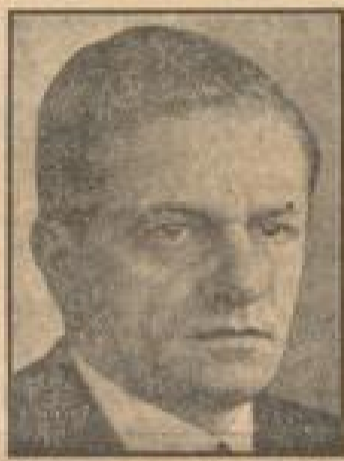
Der Dichter Hanns Johst