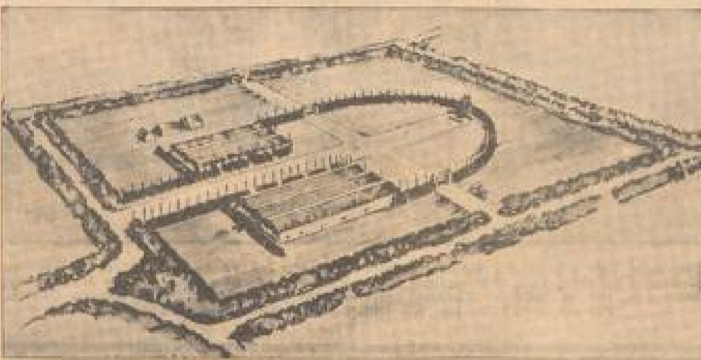
Tag Hofmarksgelände für den 2. Reichsbauerntag... der vom 12. bis 18. November in der alten Stadt Goslar stattfinden wird...