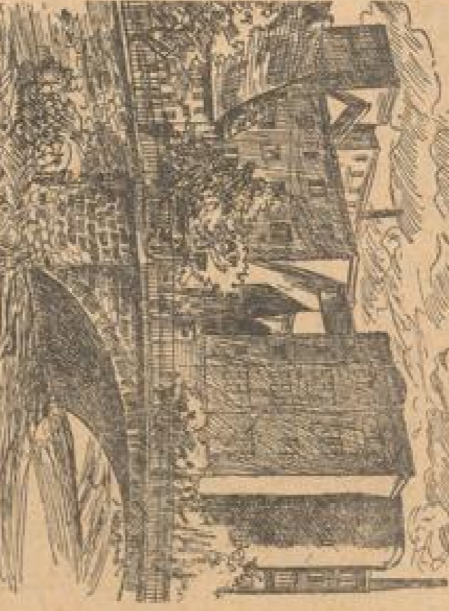
Die Dresdener Frauenkirche.

Dresden ist heute eine der größten Städte Deutschlands. Die Stadt hat sich in den letzten Jahrzehnten stark verändert.