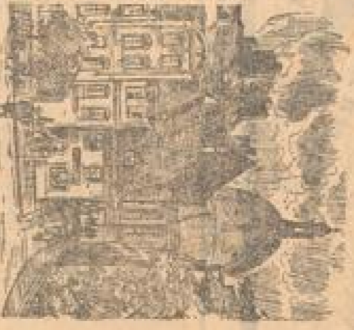
Die Kirche St. Nikolai in Dresden.

Wagner lebte in Dresden bis zu seinem Tode im Jahr 1883. Er verlebte dort die meiste Zeit seines Lebens.