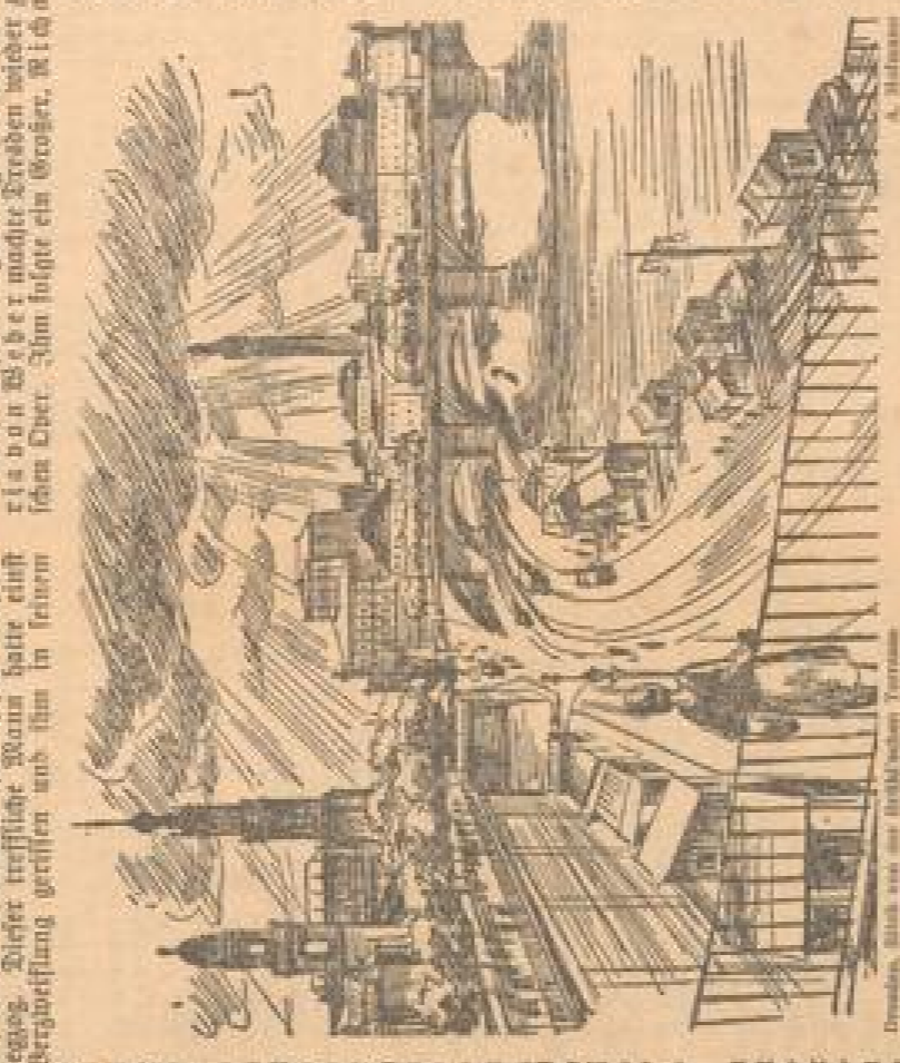
Dresden, Blick von der Festungstrasse

Der Dresdener hat eine große Liebe zu seiner Stadt. Er liebt die Freiheit, die er in Dresden gefunden hat. Er liebt die Kultur, die er in Dresden geschaffen hat. Er liebt die Kunst, die er in Dresden gepflegt hat. Er liebt die Wissenschaft, die er in Dresden betrieben hat. Er liebt die Literatur, die er in Dresden geschrieben hat. Er liebt die Musik, die er in Dresden komponiert hat. Er liebt die Architektur, die er in Dresden geschaffen hat. Er liebt die Gärten, die er in Dresden angelegt hat. Er liebt die Parks, die er in Dresden angelegt hat. Er liebt die Plätze, die er in Dresden angelegt hat. Er liebt die Straßen, die er in Dresden angelegt hat. Er liebt die Gebäude, die er in Dresden gebaut hat. Er liebt die Denkmäler, die er in Dresden errichtet hat. Er liebt die Museen, die er in Dresden gegründet hat. Er liebt die Bibliotheken, die er in Dresden gegründet hat. Er liebt die Schulen, die er in Dresden gegründet hat. Er liebt die Universitäten, die er in Dresden gegründet hat. Er liebt die Klöster, die er in Dresden gegründet hat. Er liebt die Kirchen, die er in Dresden gebaut hat.