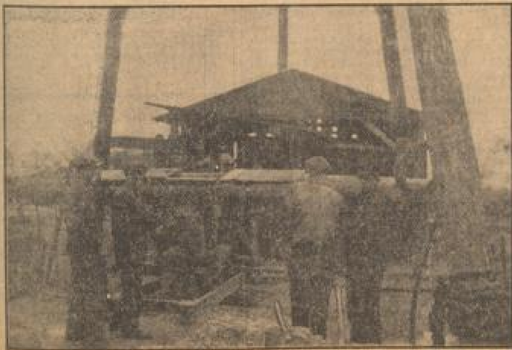
An der zweiten im Walde befindlichen Oel-Bohrstelle

Die Kraftstation des Bohrturmes. Die Rollen der Rakyschen Bohranlage. Er hält den aus Hartstahl bestehenden Bohrmößel.