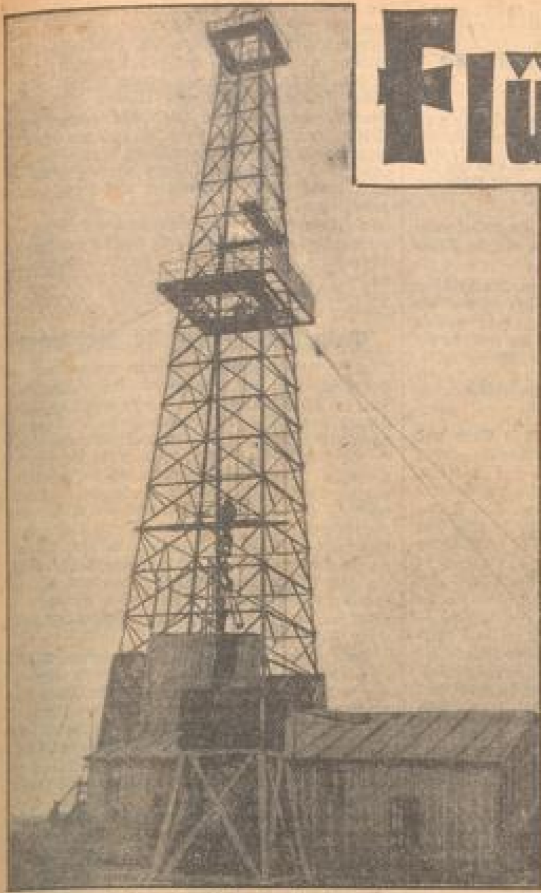
42 Meter hoch ist der Forster Bohrturm.

Jagd auf Erdöl in Nordbaden - Im Schatten des Forster Bohrturmes - Das Bohrgestänge bereits in 850 m Tiefe