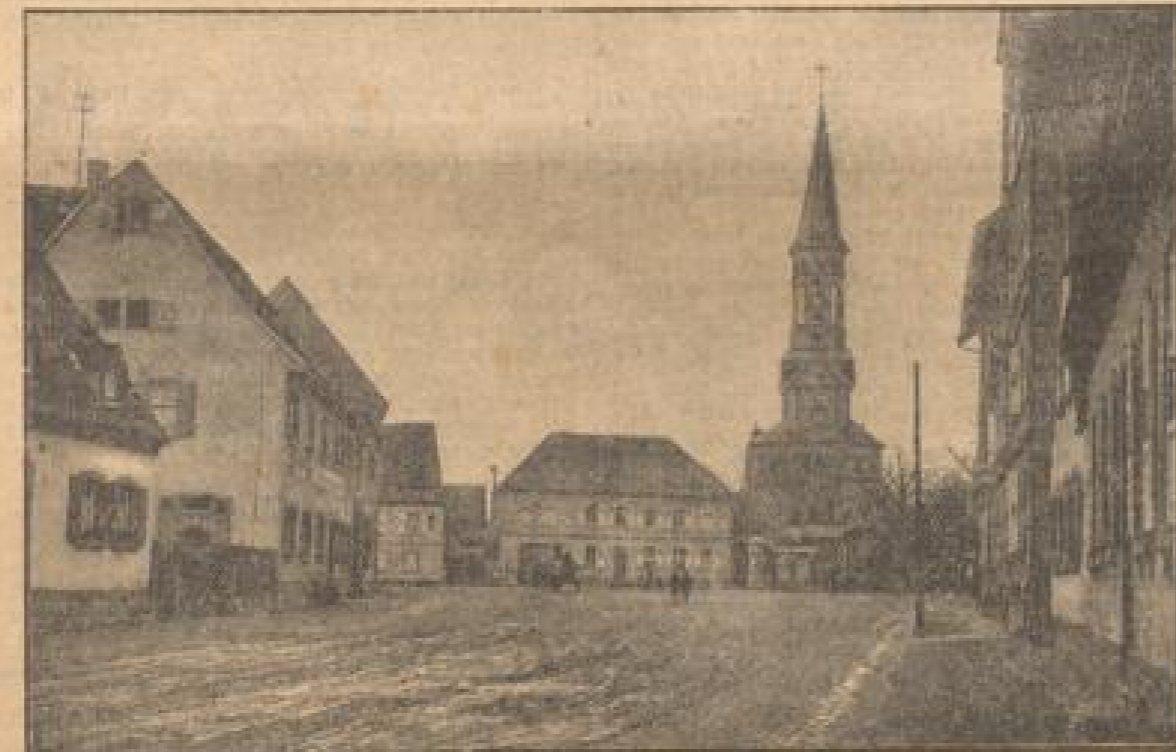
Das ist das Dorf Forst, das von einer großen Zukunft träumt.

Der Turm, der mitten im Ackerlande von Forst liegt, der 42 Meter hoch ist und an dessen fahelernen Rippen ein großes weißes Schild den Namen "Tag", die Abkürzung der Bohrgesellschaft, verleiht, wirkt unter dem blauen, nie ruhenden Himmel der Bohrmaschine. Es ist eine eiserne, räumlichste Bühne, auf der die Bohrmaschine