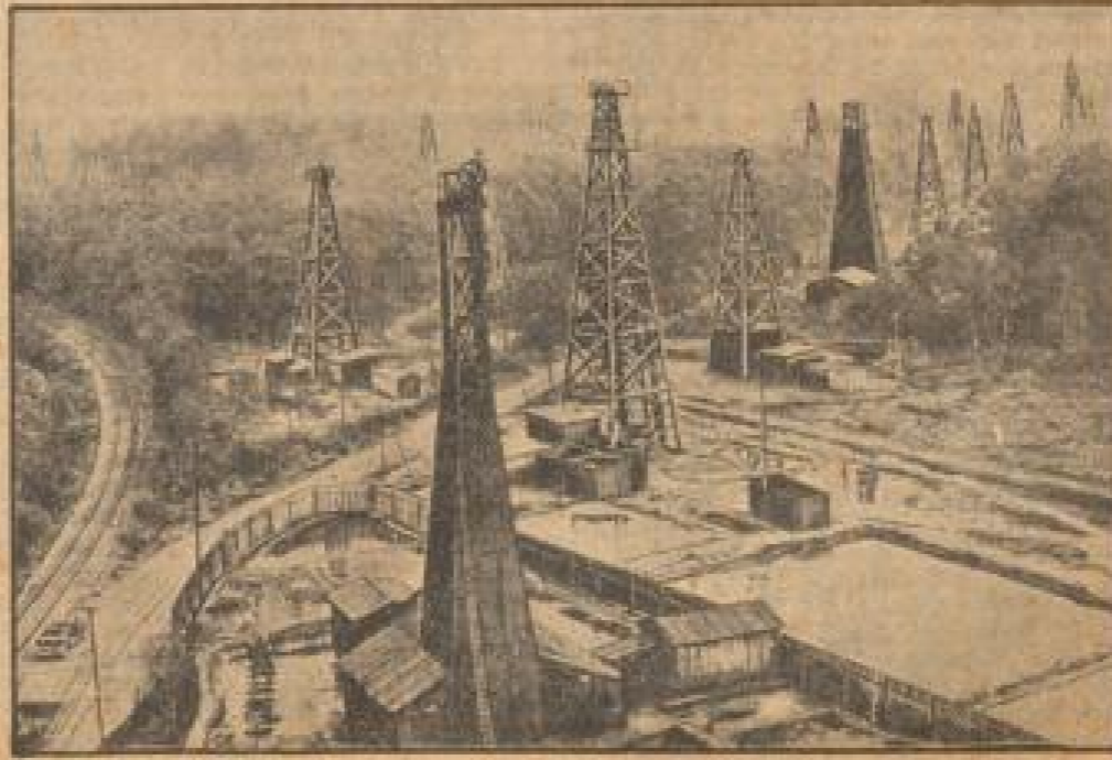
Wird das badische Forst einst ein solches Bohrturmfeld wie Nienhagen besitzen?