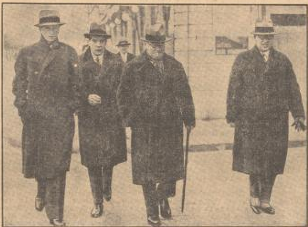
Andréo, Außenminister (Mitte) mit den Herren seiner Delegation auf dem Wege zur Sitzung der Völkerbundkonferenz...