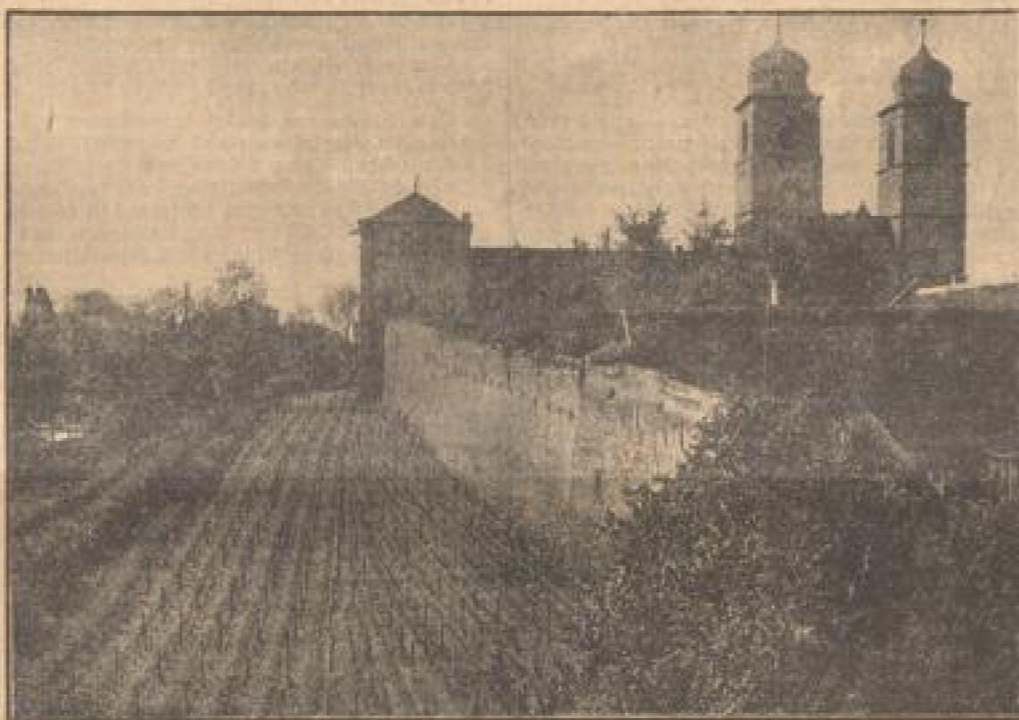
Der Luginsland, ein alter, fester Turm, in dem Heinrich VII. gefangen saß

Bei den Reichstagen, die einst, als Worms noch im Zenit seiner Bedeutung stand, hier am Rhein abgehalten wurden, hat der Wein immer eine besondere Rolle gespielt. Es war der Wein, der in den weiten Gärten rings um die Liebfrauenkirche