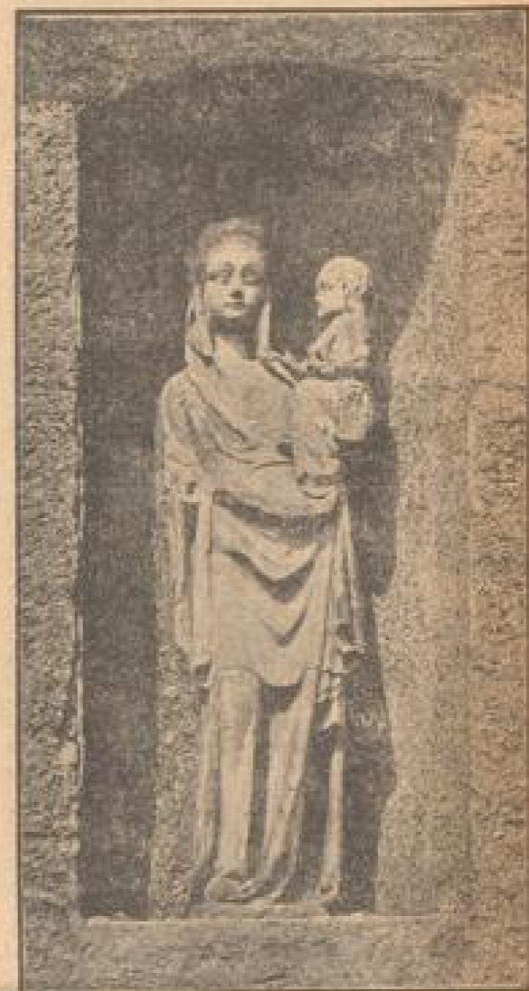
Die Madonna mit den großen Augen

Der kahle Rajen deckt längst die Gebirge der alten mächtigen Kaiserherren, die Josthuden mit ihrem lürmenden Jochbetrieb sind nicht mehr. Der letzte Fürstbischof von Worms liegt in der gleichen Erde wie die weltlichen Herren, die er nie leiden konnte. Verstorben sind die Mächte, deren Wünsche sich in gut auf die Kultur der Weiben verbanden. Die Weingelede klingt von seinem Turm mehr, die