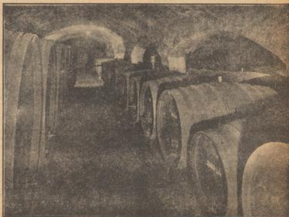
Tief unter den Rebentügel schlemmert der edelste Wein in mächtigen Fässern