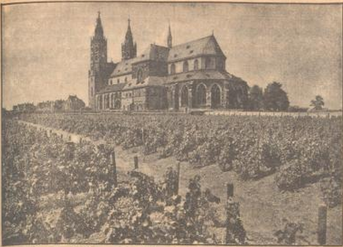
Über der Pracht der grünen Weinberge leuchtet die Wormser Liebfrauenkirche

Ein Gang durch Weinberge und Keller der Wormser Liebfrauenmilch