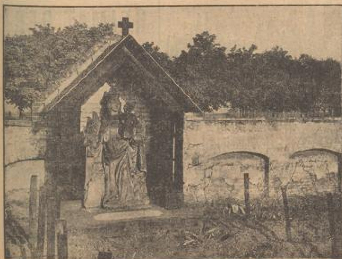
Mittelalterliche Schutzmantel-Madonna behütet die Weinberge an der Liebfrauenkirche