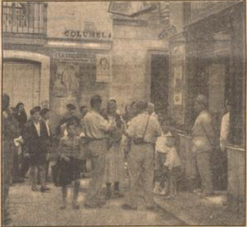
Deutsche Wandervögel singen in Cadix

zwei ebenso blonde Wädel. Sagen hier vor spanischem Publikum vor dem Partier, der mit schaumbehangenen Messer in der Hand vor seinem Boden steht, vor Männern, die aus einer Bar herangekommen sind, vor dunkelblauen Frauen, die den schwarzen Schleier tragen und munteren Bengeln, denen die Basennähe Kot zu Gesichts steht. Sie sind durch ganz Spanien getripelt, die vier Landdiente und sie wollen jetzt hinüber nach Portugal und sind begeistert, als wir erzählen, daß wir auch dort hin wollen.