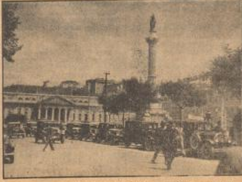
Das Bronzestandbild Peters IV., dahinter das Nationaltheater