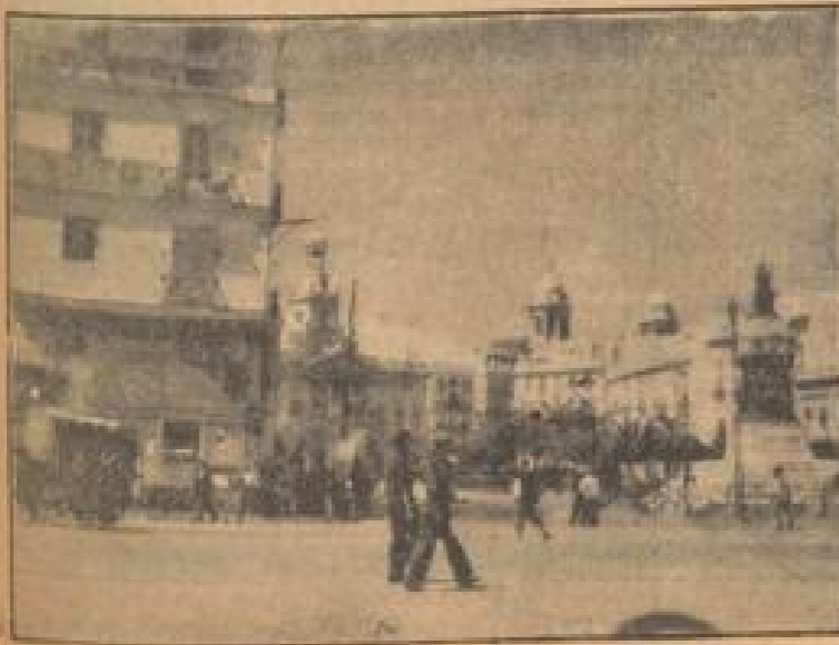
Sonne, Palmen, schimmernde Kuppeln — das ist Cadix!

So ein Stück Alt-Lissabon ist die Ruine der im 14. Jahrhundert errichteten Kirche der Jungfrau vom Berge Carmel, die Igreja do Carmo. Das Erdbeben von 1755 zerstörte das Gotteshaus bis auf die heute noch stehenden Außenwände und die herrlichen gotischen Pfeiler. (Fortf. auf Seite 4)