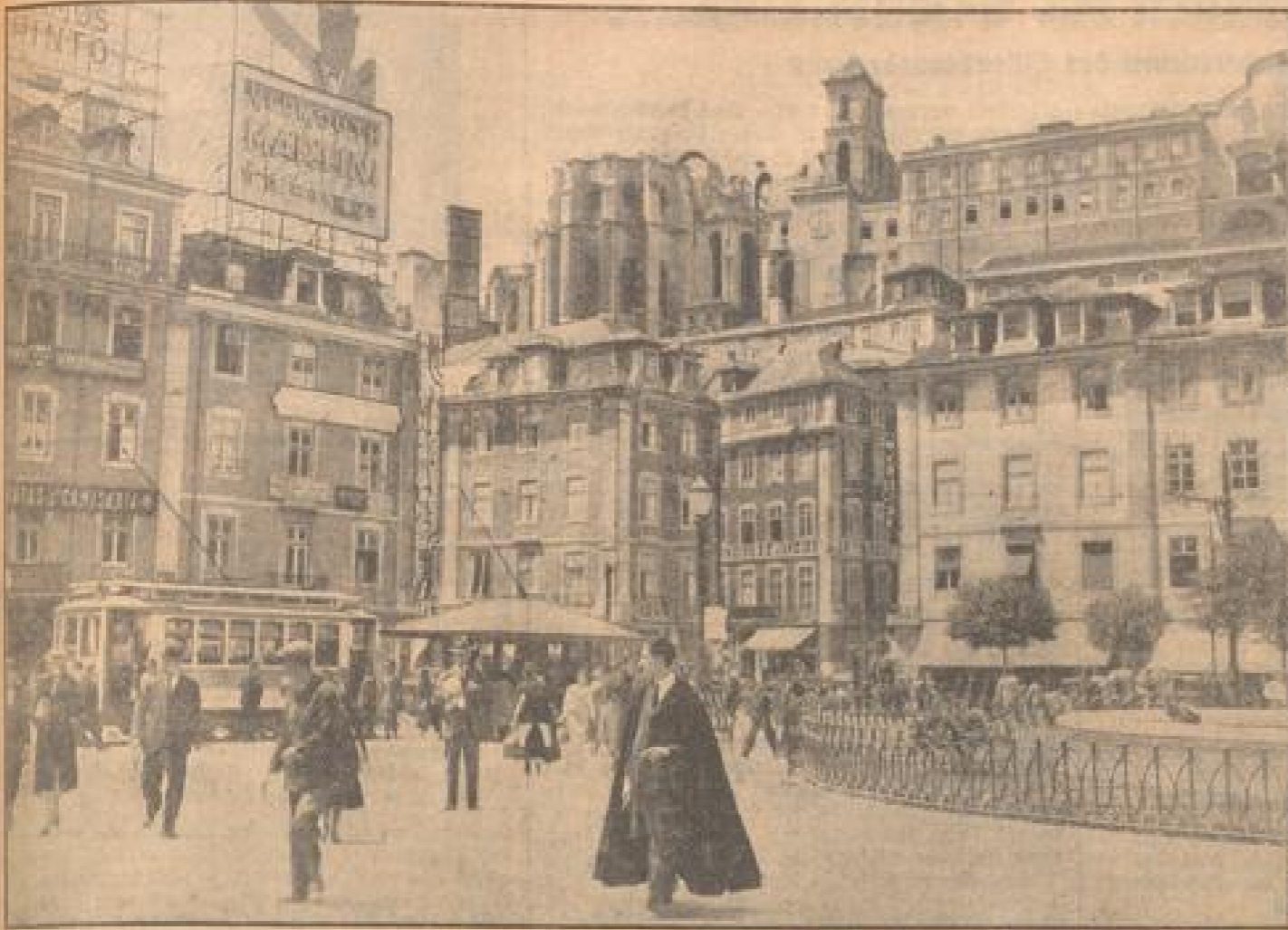
Im Herzen von Lissabon: Die Praça de Dom Pedro IV. — Im Hintergrund (Mitte) die Ruine der Kirche Igreja do Carmo