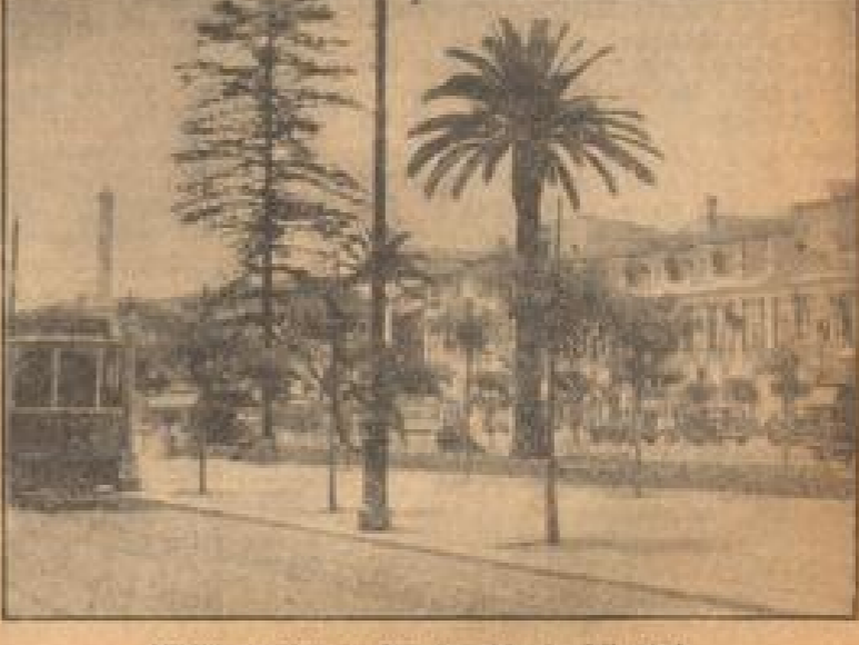
Palmen stehen in der Avenida da Libertad