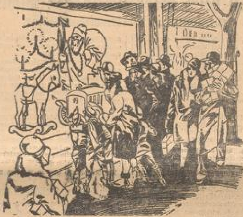
In den Schaufenstern laden uns die weihnachtlichen Anstalten.

Was gibt wohl den Adventswochen, der vorweihnachtlichen Zeit ihren zauberhaften Schimmer? Es ist nicht nur der Schein der Adventskerzen, die, Sonntag für Sonntag in größerer Zahl, an den Adventskränzen aufblühen, es ist nicht allein das allgemeine Froren auf das frohliche Fest mitten im Winter — o nein, es ist eine tiefere Seligkeit, die sich zeigt in die Herzen senkt und aus den Augen strahlt: es geben große Dinge vor, jeder hat sein Geheimnis zu lösen, einer hat vor dem anderen etwas zu verbergen. Stimmte Andeutungen und verständnisvolles Augenzwinkern über den Frühstückstisch hinweg, halbe Worte, schnell auf der Zunge geflüstert, und erschrockenes Stillschweigen, wenn irgendwo eine Tür klopft — ach, was soll ich mehr über die süße, aufregende Freude des Schenkens sagen, die überall daheim ist, wo ein echtes, deutsches Weihnachtsfest gefeiert wird. Wir wollen ja am Heiligabend nicht nur träumen und in die Zweige des Weihnachtsbaumes sehen, wollen nicht nur die Familienangehörigen um uns versammeln und Weihnachtslieder mit ihnen singen. Die Liebe zu unseren Nächsten freudig und, etwas für sie zu tun, ihnen einen Herzenswunsch zu erfüllen und ihnen unsere Unabhängigkeit zu beweisen. Geschenke, mit Liebe ausgewählt, mit Liebe gearbeitet, sind ein Zeichen unserer Freundschaft und Treue.