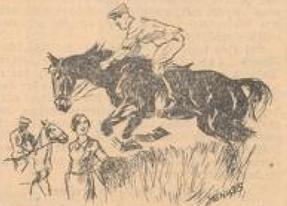
Der Junglandwirt als Herrreiter

einem Strom von Redensarten. „Den Bauer anstreifen“, nennt er dieses Leben, dieses Fieberverirren und seine befristeten Hoffamantente, bei denen er zur Ehre, zu Glück, zu Ruhel und zu Viefer gegriffen hat. Wenn zu lange Ohren werden beschritten, sollte Ohren mit Pracht angelegt und zusammengezogen, nachdem vorher die Schenkel durchschnitten und wieder zusammengeheßt sind. Schlechte Abscheu oder haarlose Stellen werden angekröhen.