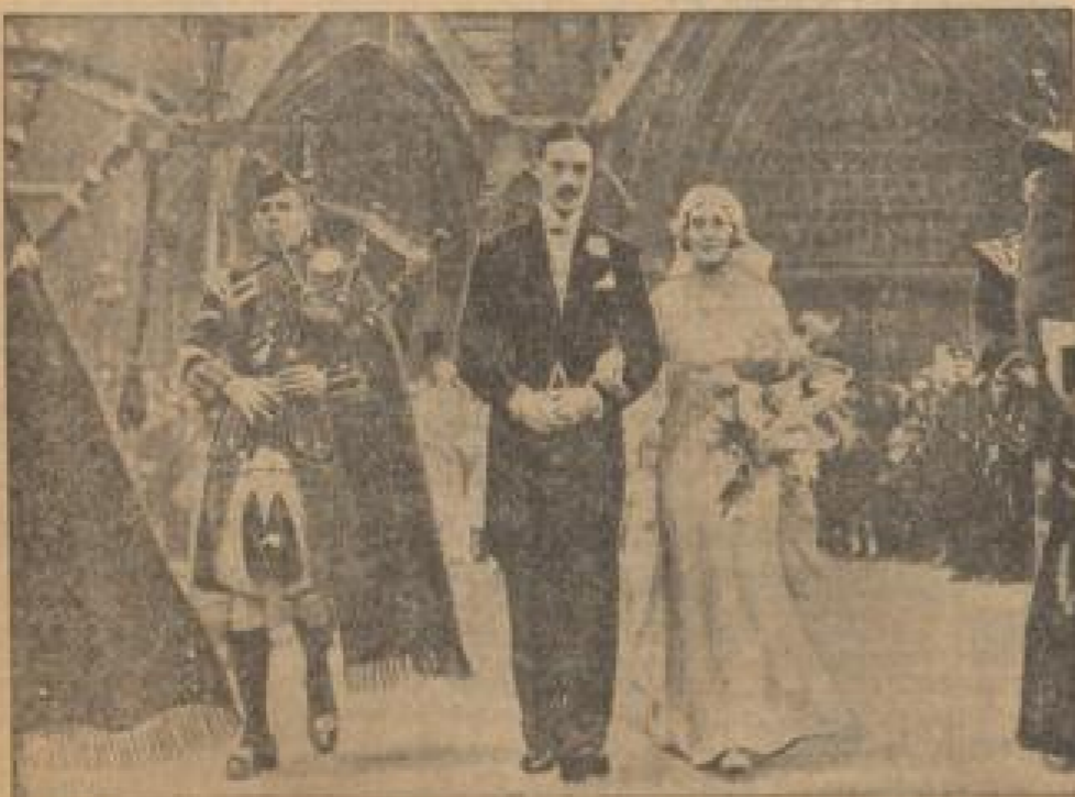
Bei der Eröffnung eines Chores der Schottischen Weiber wurde das Hauptwort beim Verlassen der Kirche mit Dudelsack-Musik ertönt. Oben: Die Kinder in der Musikschule der Stadt München, die mit Dudelsack-Musik unterrichtet werden. Unten: Die Kinder in der Musikschule der Stadt München, die mit Dudelsack-Musik unterrichtet werden.

Löwenstein hat dann in rascher Folge die Tabak- und Weinindustrie beherrscht.