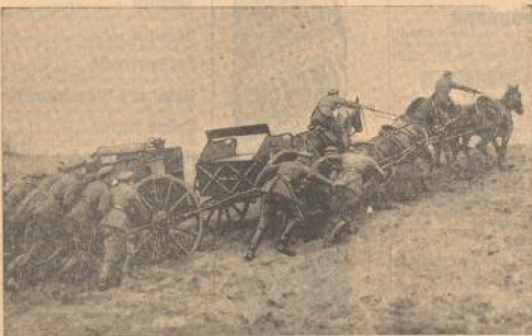
Munitionswagen eines Artillerie-Regiments wird einen Hügel hinaufgeschafft.

In allen Reichsteilen werden jetzt die ersten Frühjahrs-Geländeübungen im Gelände durchgeführt, die vor allem die ausgleichenden Befehle, mit den Bedingungen der Kriegsverhältnisse vertraut machen sollen.