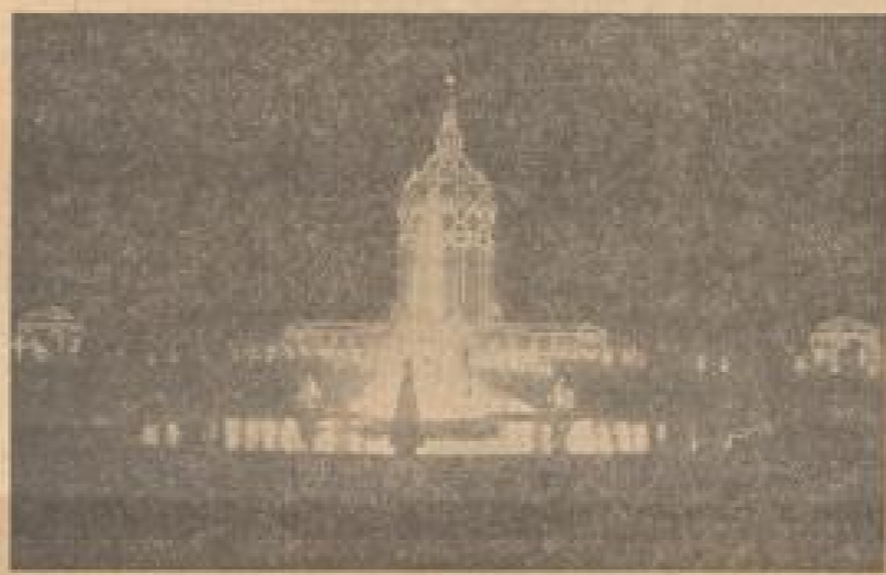
Wasserturm und Leuchtfontäne in Abendtolleite

mächtige Wasserturm emporschleibt, von dem Runderweg nach dem Wasserturm zu als Ausläufer der Wasserturms verlegt wurde.