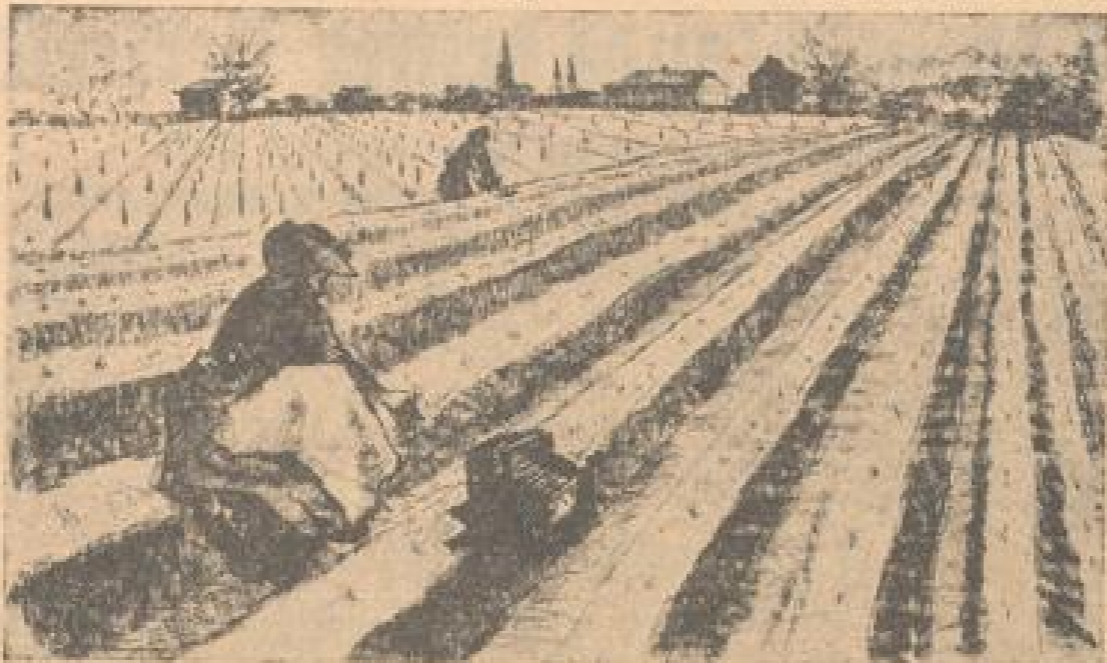
Spargelacker bei Räfertal

Aufgabe gestellt haben, einen Bestand einzurichten, zumal man mit einer gesteigerten Nachfrage nach auswärts noch rechnete. Hier ergeben sich für den Bereich Räfertal durchaus erfreuliche Aussichten in volkwirtschaftlicher Beziehung, zumal auf der Ge-