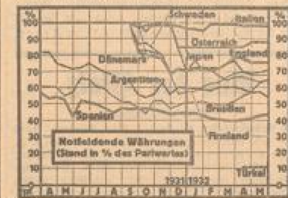
Nach den Währungen der verschiedenen Länder...