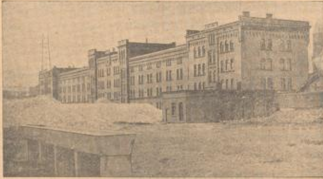
Die letzten Befestigungsreste werden in Mainz zerstört.

Nach den Bestimmungen des Versailler Vertrags sind die Befestigungen des Rheinlandes bis zum 30. Juni dieses Jahres beseitigt zu sein. In Mainz, der einstmals die besten Befestigung an Rhein, werden jetzt die noch verbleibenden Wälle und Unterhöhlen eingeebnet und der letzte Militärposten abgezogen.