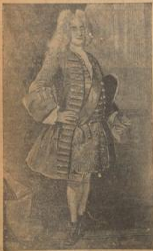
August der Starke, Kurfürst von Sachsen, König von Polen. (Originalgröße vergrößert.)

Und sind die Beziehungen Augusts des Starken insbesondere zur Goldschmiedekunst, so ist er doch im Schmuck und in den anderen wesentlichen Teil seiner Weltanschauung verflochten. Von der frühen Regierungszeit bis zur Königswahl trug er z. B. Krone für ein vergoldetes Zweifelhörnchen, das in Augsburg angefertigt und in der Residenz Dresden aufbewahrt wurde. Bis zum Jahre 1700 wurden auf der Leipziger Messe jährlich für 5000 Taler Silberwaren von Goldmann in Landshut bezogen. Und 1704 vollendete der Gold- und Silberarbeiter Arminius in Dresden das "andere Zepter" von dem doppelten Ährenbüschel über dem Helm. Wer kennt nicht im Grünen Gemälde das schöne emaillierte Schmuckstück, eine besondere Zierde der Goldschmiedekunst, die bekannte Tafeluhr, die schöne Elfenbeintafel und die besonders kostbaren Gefäße aus Elfenbein, die in Dresden das "andere Zepter" von dem doppelten Ährenbüschel über dem Helm. Wer kennt nicht im Grünen Gemälde das schöne emaillierte Schmuckstück, eine besondere Zierde der Goldschmiedekunst, die bekannte Tafeluhr, die schöne Elfenbeintafel und die besonders kostbaren Gefäße aus Elfenbein, die in Dresden das "andere Zepter" von dem doppelten Ährenbüschel über dem Helm.