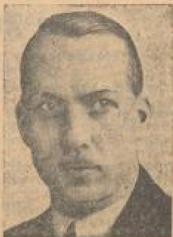
Landtagspräsident Wilhelm, der Reichstagsauflösung im preussischen Landtag beantragt.