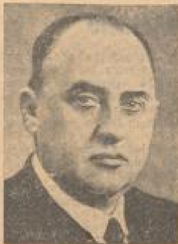
Walter Funk, der zum Reichspräsidenten ernannt wurde.