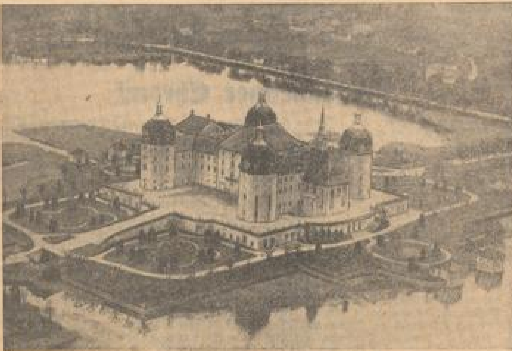
Das Wackerbarth Palais bei Dresden.

Wahret die Grenzen, daß viel Geld ins Land kommt und wenig hinausgeht! Das war