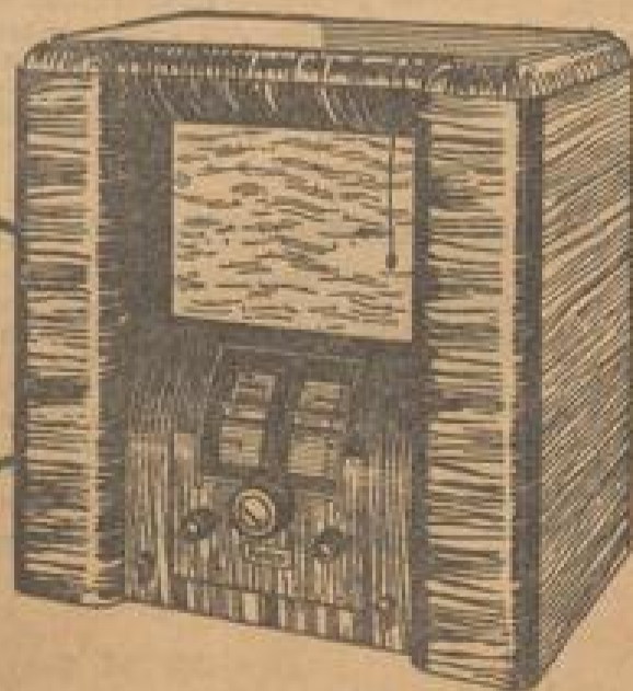
„Atlantis“-Combi mit eingeh. v. d. m. Lautsprecher u. prakt. Programm-Leslampe Preis RM 168.- u. R.