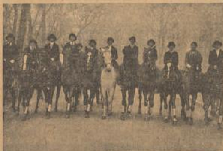
Kann's was Schöneres geben, als einen Ausritt in lustiger Gesellschaft — Nach einer Stunde im Freien geht es wieder zurück zur Reitbahn

Es gibt in der Reitbahn zwei Zirkel, das sind zwei gedachte Kreise, die von dem Schüttern zu durchreiten sind, von einem Punkt an der linken Wand nach einem Punkt an der rechten Wand „angeführt“