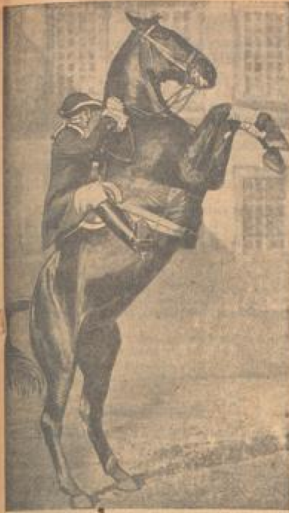
Eine prächtige Paradefigur