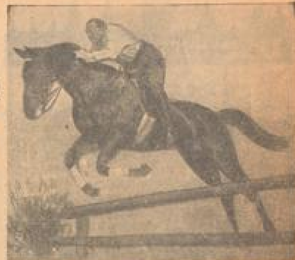
Fürscher Spring über die Hürde

„Nebenbei auf keinen Fall ist das Reiten ein Luftsport. Die Stelle für den Unterricht sind zu gehalten, daß eigentlich jeder in der Woche zwei, drei Stunden nehmen könnte“, also sprach mein Führer durch diese Welt, die dem Pferdesport gehört. „Aber mein Interesse ist noch nicht zu Ende. Gern würde ich ein Journalist einmal in die Reitbahn über den Gang der Ausbildung über die Ausbildung des Reitsports im Sommer und im Winter und ich erlaube so viel, daß ich eigentlich heute schon ein Turnierleiter in der Theorie sein könnte. In der Praxis läßt es allerdings wesentlich anders aus. Da hätte ich zuerst einen kombinatorischen Schreier abzulegen und an der Lunge, die ein Stallmeister führt, jahre Reibebewegungen auszuführen.“